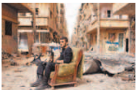
反對派士兵坐在戰區一個沙發上。