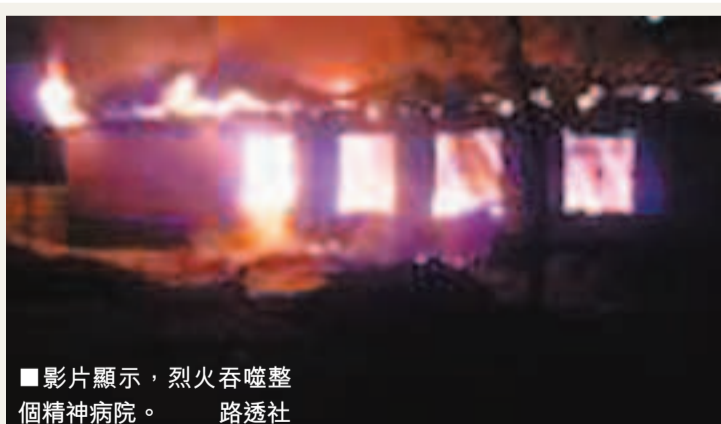
影片顯示，烈火吞噬整個精神病院。