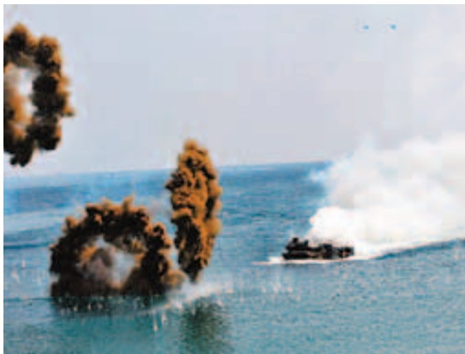
美韓海軍陸戰隊昨舉行搶灘演習。