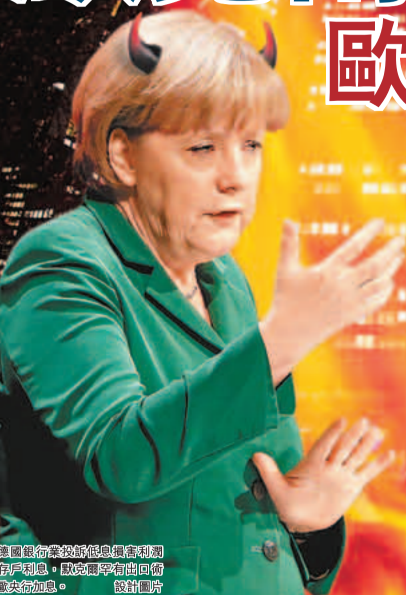
德國銀行業投訴低息損害利潤及存款利息，默克爾罕有出口術，促歐央行加息。

德國總理默克爾罕有加入歐洲的利率爭論，她前日表示，低利率已對德國銀行業及存款戶構成不良影響，認為歐央行需要加息，但又強調許多財困國需要更寬鬆信貸環境。西班牙和法國失業加劇，加上南歐經濟深陷泥沼，歐央行難有加息空間，經濟師更預期或會減息。默克爾出口術施壓，無疑令歐央行左右為難，也加深南歐財困國與北歐富裕國的裂痕。 除默克爾外，德國財長朔伊布勒早前亦要求歐央行「抽乾流動性」。為免讓人產生干預央行獨立性的印象，德國政府極少就歐央行利率政策開腔，但因德國銀行業紛紛投訴低息損害利潤及存款利息，且可能催生德國樓市泡沫，默克爾被迫表態，以安撫國內不滿。其發言人昨澄清，默克爾無意左右歐央行利率決策。 德央行斥歐央行無限買債 歐央行基準利率自去年7月起一直維持0.75厘，路透社訪問76位經濟師，過半預測央行會在下周會議宣布減息。前歐央行官員斯馬吉認為，正當全球主要央行大手 加推寬鬆政策，歐洲有必要加以應對，否則歐元匯價將被推高，不利出口及經濟，又指減息將是第一步。 貝老稱意應抗緊縮政策 《德國商報》前日聲稱獲得一份德央行提交憲法法庭的文件，當中大肆批評歐央行直接貨幣交易(OMT)無限買債計劃，指歐央行責任不是守護歐元，OMT會損害央行資產負債表及納稅人，減少各國政府改革動力等。德央行昨證實文件屬實。自OMT去年9月推出以來，尚未有歐元國尋求協助。 有望東山再起的意大利前總理貝盧斯科尼昨稱，新政府應對抗歐洲緊縮方針及3%債務上限，指即使歐盟亦會同意緊縮政策過嚴反會窒礙經濟。 歐元區銀行上月向家庭及私人機構的貸款減少8%。另根據歐央行昨公布的調查，7,510家區內中小企去年10月至上月間融資需求增加，但要獲得銀行貸款仍然困難，反映即使信貸條件放寬，銀行仍不願用歐央行提供的流動性，令借貸及經濟活動難有改善。分析認為歐央行有必要更積極刺激信貸。 ■法新社/《華爾街日報》/英國《金融時報》/CNBC