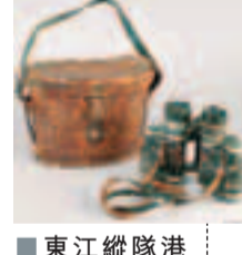
東江縱隊九獨立大隊隊員曾經使用的望遠鏡。