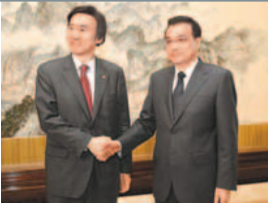
李克強昨日在北京中南海紫光閣會見韓國外交部長尹炳世。

中方在半島核問題上秉持公正和負責任態度，當務之急是各方保持冷靜克制，採取積極主動措施，緩解緊張局勢，促使問題重回對話解決軌道。雙方還商定開通兩國外長熱線，加強戰略性溝通。