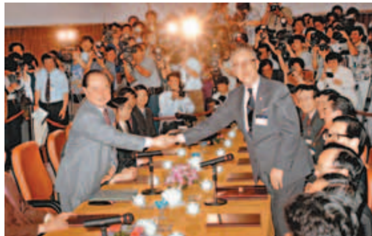
海協會27日至29日將舉辦汪辜會談20周年紀念活動。圖為1993年4月在新加坡舉行的「汪辜會談」。

范麗青表示，在前四屆論壇成功舉辦的經驗基礎上，本屆論壇將更加突出「民間性、草根性、廣泛性」，更加注重實際功效。論壇將首次舉辦兩岸公益論壇，繼續舉辦台灣特色廟會、台灣縣市推介會等。本屆論壇還將增加台灣主辦單位的數量，以適應兩岸與會民眾和不同群體的需求，使與會的嘉賓都有能夠參與的活動項目。