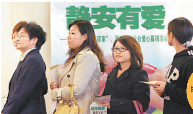
內地民眾逐漸建立奉獻精神。

還有很多單位要求紅十字會在本單位設置捐款箱,動員員工捐款,並由紅十字會清點款項。甚至有人採用傳統的街頭動員方式進行募捐。