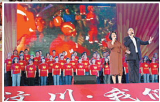
義演的號召力和感染力較強。