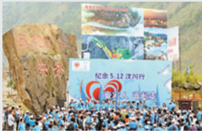
李連杰的「壹基金」被指在籌款上「搭便車」。

對大部分無募捐資格的社會組織而言,有的採用「搭便車」方式,獲取募捐合法資格。如李連杰的「壹基金」2007年在北京正式啟動,它作為專項基金掛靠在具公募資格的中國紅十字會名下,可借助該會名義向社會公開募捐。這種「搭便車」方式在去年3月通過的《長沙市慈善事業促進條例(草案)》獲得確認。