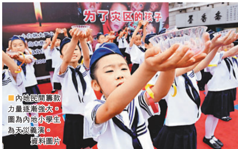
內地民間籌款力量逐漸強大。圖為內地小學生為天災義演。資料圖片