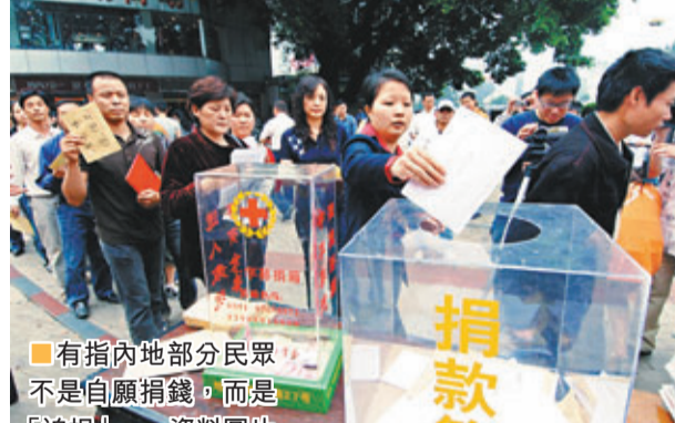
有指內地部分民眾不是自願捐錢,而是「迫捐」。

當捐贈行為出於人道主義精神、社會責任感、奉獻精神時,才能帶來可持續發展。若出於面子或政府動員,捐贈不可能持久。在社會危機平復後,捐贈只是曇花一現,