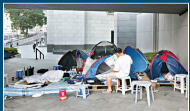
▲葵涌貨櫃碼頭罷工工人將示威營地擺在長江中心側鄰的天橋底。