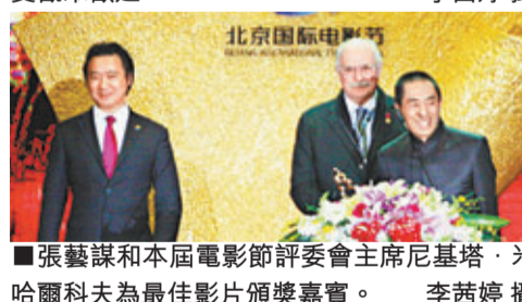
張藝謀和本屆電影節評委會主席尼基塔·米哈爾科夫為最佳影片頒獎嘉賓。