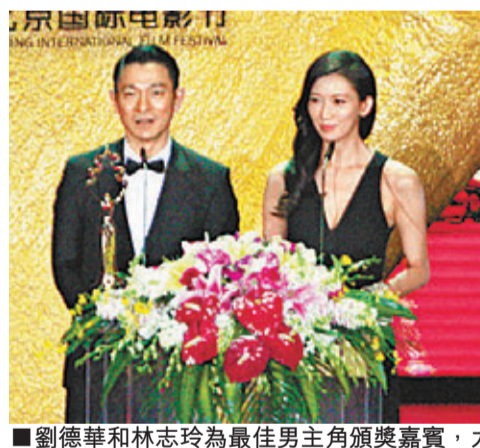
劉德華和林志玲為最佳男主角頒獎嘉賓，大受觀眾歡迎。