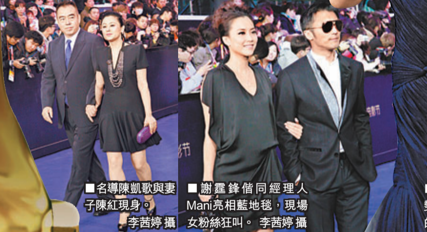
名導陳凱歌與妻子陳紅現身。