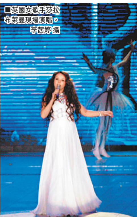
英國女歌手莎拉布萊曼現場演唱。