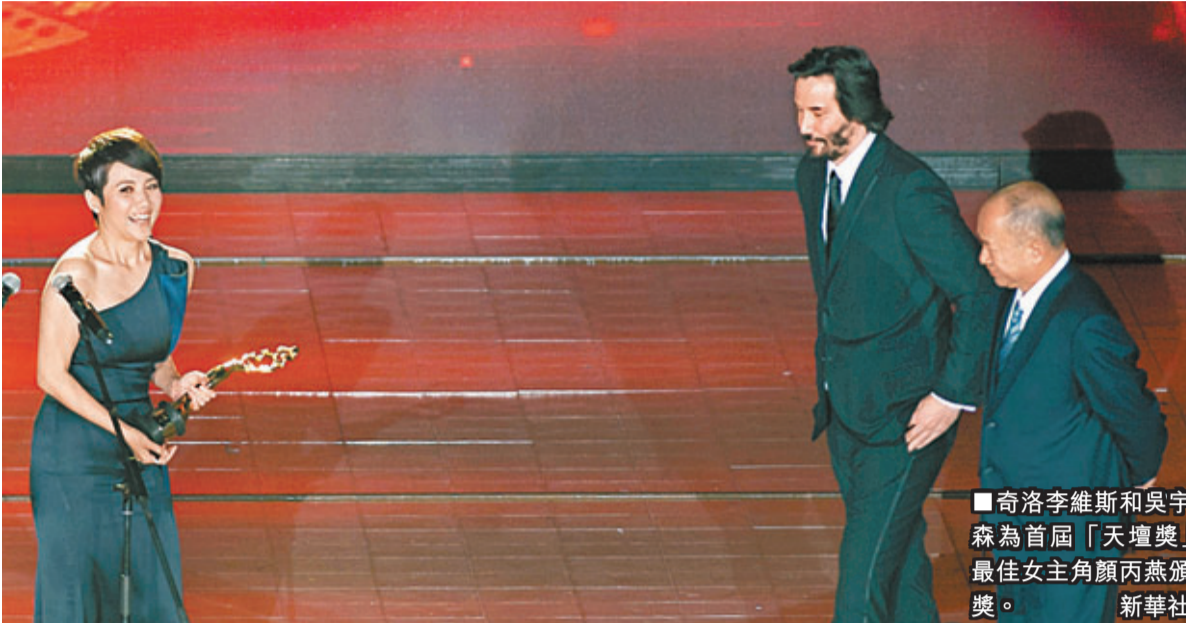
奇洛李維斯和吳宇森為首屆「天壇獎」最佳女主角顏丙燕頒獎。

此外，本屆電影節的閉幕式還別具匠心的將富有中國元素的武術、京劇、雜技融入頒獎典禮之中，周杰倫用一曲《雙截棍》向李小龍等多位中國功夫巨星致敬。而國際巨星莎拉布萊曼則帶來了《歌劇魅影》主題曲，將頒獎典禮推向了高潮。本屆北京國際電影節為期7天，展映中外佳片260部中，成功舉辦了北京展映、電影魅力、北京論壇、北京電影市場、電影嘉年華等主體活動。電影節期間還達成27個項目簽約，總額高達87.31億元人民幣。