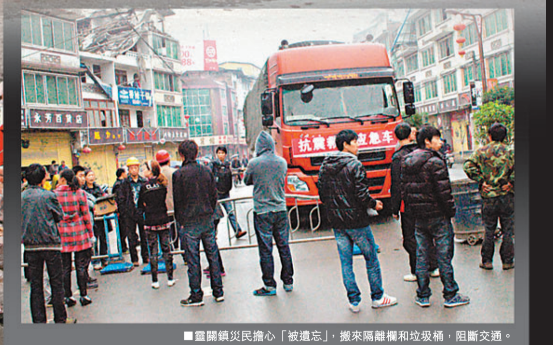
■靈關鎮災民擔心「被遺忘」，搬來隔離欄和垃圾桶，阻斷交通。