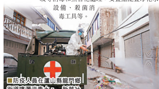
■防疫人員在蘆山縣龍門鄉街道噴灑消毒藥水。新華社

對政府而言，相關部門要迅速安排專門衛生防疫力量，及時對水源進行監測消毒，加強食品和飲用水衛生監測，妥善處理避難者遺體，做好死亡動物、醫療廢棄物、生活垃圾等消毒和無害化處理，安置點配置淨化水設備、殺菌消毒工具等。