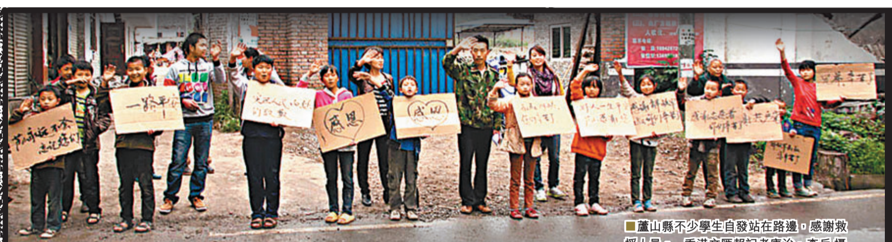
■蘆山縣不少學生自發站在路邊，感謝救援人員。