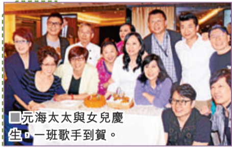
元海太太與女兒慶生，一班歌手到賀。

Leehom感慨道：「近期在東西方四川、波士頓都發生了天災和人禍，所以誠心祈禱世界上各民族的人，都盡量可以以愛去包容世間萬物。」而Leehom也表示接下來將繼續通過一直合作的「世界展望會」以最實際的行動去幫助需要幫助的人。此次演講的主題是「認識華流」，Leehom稱想讓更多人看到東方文化的博大精深，他表示：「東方和西方就像大學一年級室友，如果想要愉快地共存，必須了解、理解對方。雙方像室友一樣，都需要盡自己的努力改善關係，並共同成型全球流。我一直想把東方文化帶到世界各地，之前音樂裡面也有用過很多中國的元素，讓更多人看到東方文化的不同和博大精深。」