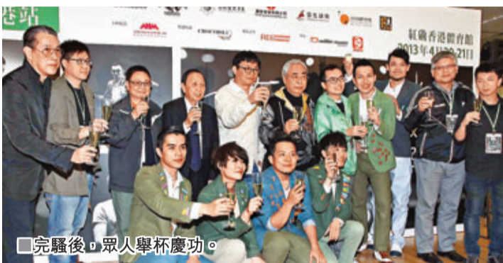
完騷後，眾人舉杯慶祝。

香港文匯報訊 (記者 李思穎) 台灣樂隊蘇打綠連續兩場「當我們一起走過」香港巡迴演唱會前晚在紅館順利完成，主音青峰苦練多時的廣東歌贏得全場掌聲，不過成功背後的壓力，令青峰要「告別」再唱廣東歌，青峰又被現場粉絲大叫「峰姐」，氣得他要取消點唱環節，當然青峰只是一時之氣，當晚他們愈唱愈High，唱足4小時至凌晨12時結束，最終因超時罰款6位數字。