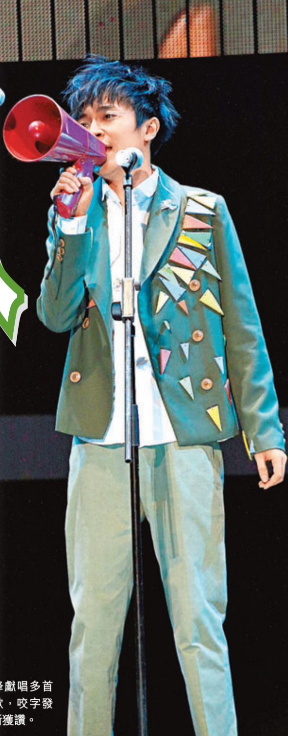
青峰獻唱多首廣東歌，咬字發音清晰獲讚。

完騷後，6位成員接受訪問，問到青峰很介意「峰姐」稱號嗎？他笑笑說：「跟大家開玩笑，只是演一下，我演得太好了。」說到不再唱廣東歌，他認真謂：「是的，壓力很大，唱自己的歌便好了」，完成演出後接受訪問，問青峰是否很介意這個稱呼？他說：「也沒有，跟大家開玩笑而已。(你生氣?)我是演員要演一下，我演得太好了！」他們又興奮表示頭場黃秋生來捧場，簡直驚喜交集，他們也是首次見對方。