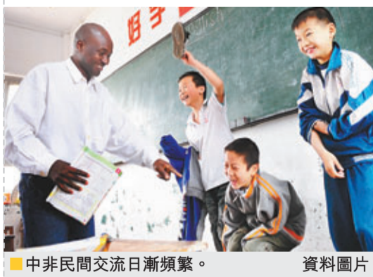
中非民間交流日漸頻繁。 資料圖片