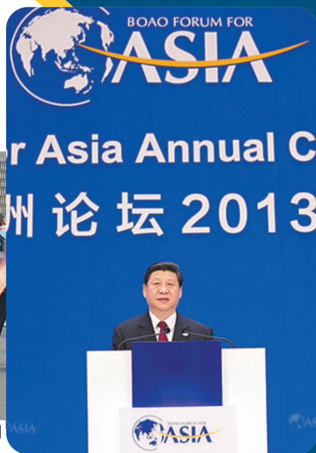
國家主席習近平在博鰲論壇指出，亞洲是當今世界最具發展潛力的地區之一。 資料圖片