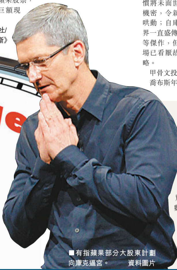
■有指蘋果部分大股東計劃向庫克逼宮。