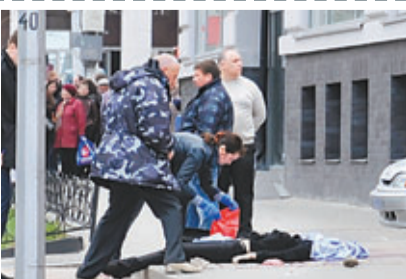
■槍擊案受害者陳屍街頭。