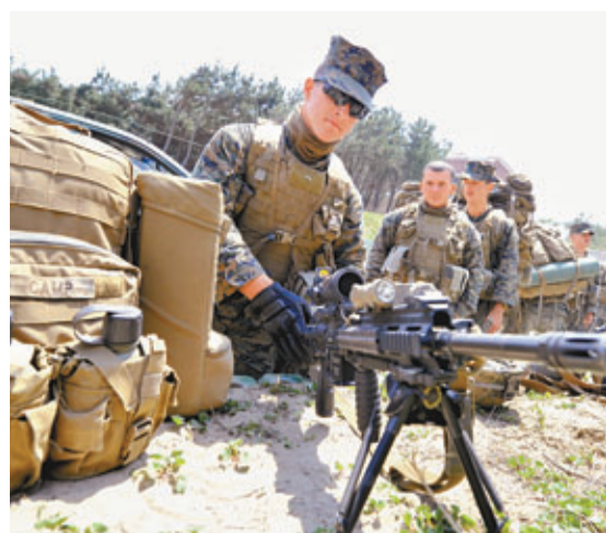
美韓士兵準備舉行聯合軍演。

朝中社昨日報道，平壤政府昨日舉行內閣全體擴大會議，決定貫徹「經濟建設和核武力建設並行路線」，抓緊煤炭工業和金屬工業建設，集中發展農業和輕工業。