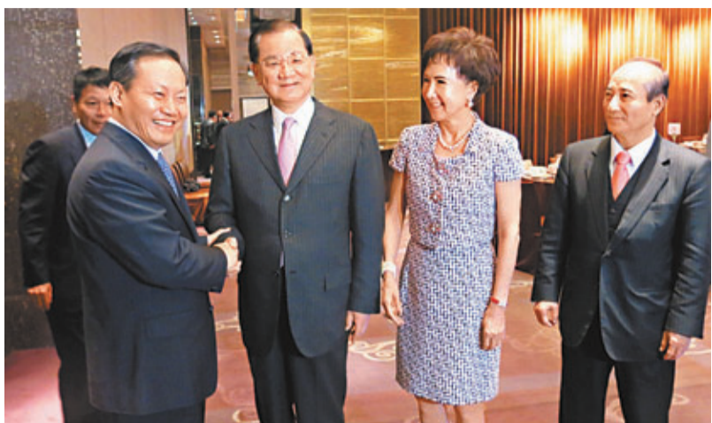
彭清華拜會連戰夫婦等。