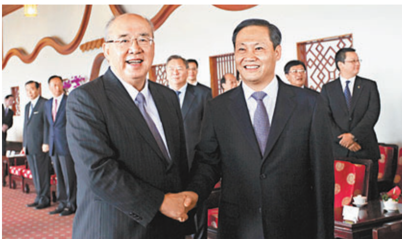
彭清華一行拜會吳伯雄。

香港文匯報訊(記者 趙飛 台北報導)中共廣西壯族自治區委員會書記彭清華,22日上午率團抵達台北,開始為期5天的經貿、文化交流之旅。抵達台北後,彭清華一行先後拜會了中國國民黨榮譽主席吳伯雄、連戰等。雙方就廣西與台灣未來在經貿文化方面的合作表達了殷切的希望。