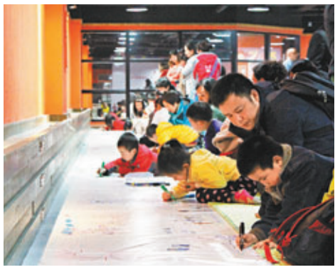
■親子合作繪畫，場面溫馨。本報上海傳真

香港文匯報訊(記者 沈夢珊 上海報導)一幅長達999米、由1,200個家庭愛心繪製、以「幸福之家」為主題的親子塗鴉作品長卷20日在江蘇省昆山市開筆。長卷完成繪製後將申報中國大世界健力士「最長的親子塗鴉作品」並現場拍賣，所得善款將捐贈予美國慈善機構「圖書館計劃」，用於扶持貧困地區希望小學設立愛心圖書館。而1,000多個參與家庭捐獻的圖書也一併納入愛心圖書館。