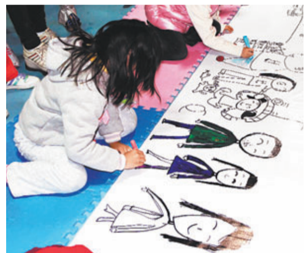
■長畫以「幸福之家」為主題，由1,200個家庭畫出其幸福家庭生活。本報上海傳真

有關活動由江蘇昆山中基置業發展有限公司「天成佳園」項目主辦，香港文匯報上海分社、美國《圖書館計劃》、上海德匯文化有限公司共同協辦。據主辦方表示，通過凝聚千組家庭的愛心，培養更多孩子的奉獻意識，聚小愛成大愛，讓更多的愛心公益行動為貧困地區的學生帶去實際的幫助。而該公司的「幸福無處不在」活動只是一個開始，他們將提供力所能及的幫助，讓「圖書館計劃」有效進行下去，以幫助更多的貧困地區小朋友。