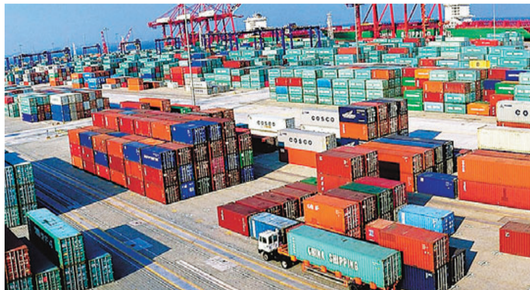
■粵計劃借助鐵路、航道等交通拓展五大樞紐港輻射腹地。圖為廣州港。本報廣州傳真

香港文匯報訊(記者 古寧 廣州報導)粵計劃借助鐵路、高速公路、內河航道等疏港交通體系，拓展五大樞紐港輻射腹地。廣東《加快推進全省重要基礎設施建設工作方案(2013-2015年)》日前公佈，計劃在「十二五」後三年投資287億元，續建7個港口碼頭項目，建成沿海五大樞紐港的鐵路集疏運體系。若相關項目按計劃建成，到2015年粵港口貨物年吞吐能力將超過13億噸，貨櫃年通過能力5,000萬標準箱。