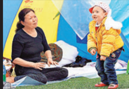
■ 兩歲的竹子微正跳舞給祖母看。新華社

■ 在四川寶興縣中學安置點內，隨時可見孩子們天真的笑容。突如其來的地震摧毀了他們的家園，卻不能阻擋純真的笑容在他們臉上綻放。新華社