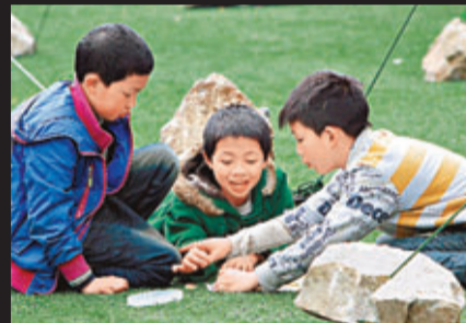
■ 三名小孩在安置點內下象棋。