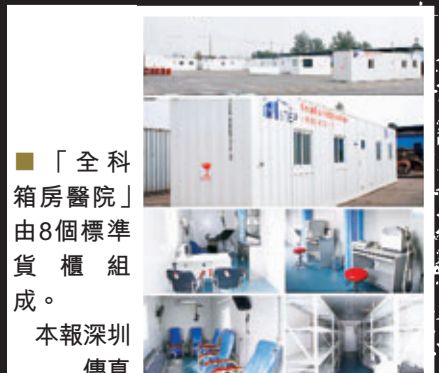
■ 「全科箱房醫院」由8個標準貨櫃組成。