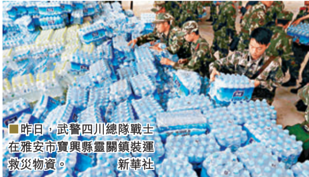
■ 昨日，武警四川總隊戰士在雅安市寶興縣靈關鎮裝運救災物資。