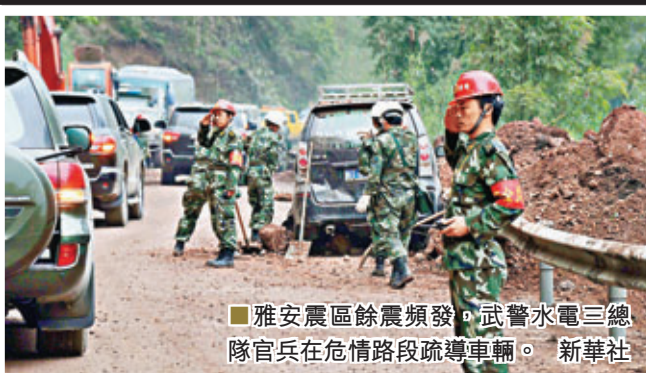
■ 雅安震區餘震頻發，武警水電三總隊官兵在危情路段疏導車輛。

另據中新社報道，四川省僑辦主任周敏謙昨日透露，據不完全統計，截至22日上午，海外僑胞、僑資企業已向災區捐款捐物近5,000萬元人民幣。