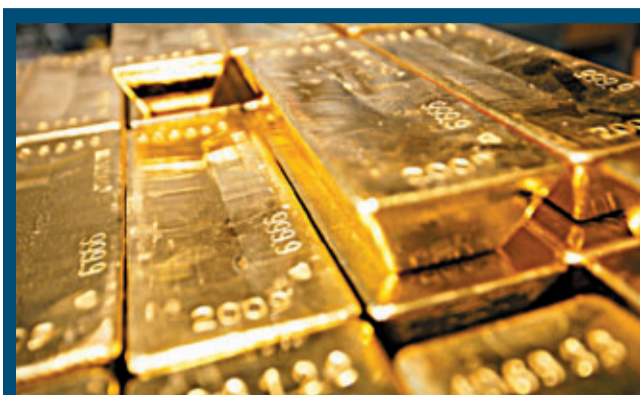
金價經日前急跌後，令黃金避險作用弱化。