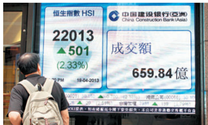
港股上周五收升501點，但受四川雅安周六地震影響，港股今料跟隨A股受壓。

香港文匯報訊(記者 卓建安)港股上周五受摩根士丹利擬將A股納入MSCI(明晨)新興市場指數、內地巨額的RQFII額度將重啟審批以及人行將於本週內宣佈擴大人民幣的波幅「三大」傳聞刺激收升501點，但周六內地卻遭遇四川雅安地震，令