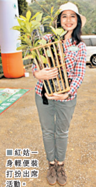
紅姑一身輕便裝打扮出席活動。

注重環保的紅姑表示早已植過樹，她呼籲政府不要貪圖方便，未了解是否有危險性便隨便斬樹，因養一棵樹需一百幾十年，發展商為起樓斬樹也很無良。