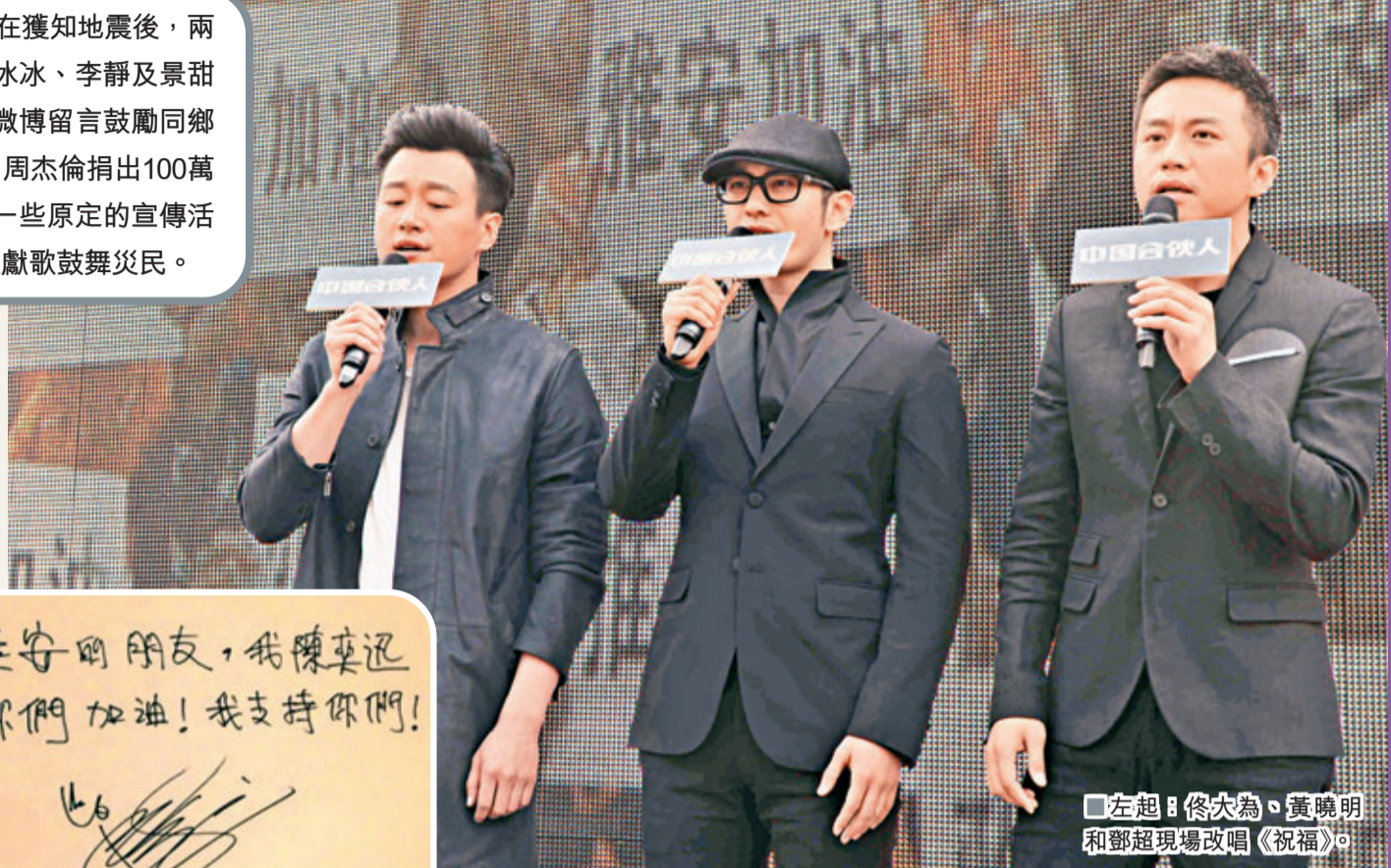
左起：佟大為、黃曉明和鄧超現場改唱《祝福》。

由李連杰創辦的「壹基金」連續兩日參與救災行動，另一民間自發基金「成龍慈善基金」亦開始行動。成龍在微博寫道：「天災是挑戰，災後重建更是挑戰，成龍慈善基金會各地的志願者已經行動起來，我們會一直關注災區情況，把捐款和物資送到最需要的時候和地方。希望大家繼續傳遞正能量！為災區祈福！」