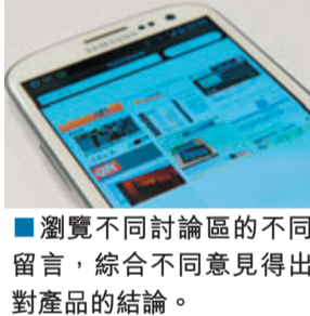
瀏覽不同討論區的不同留言，綜合不同意見得出對產品的結論。

2. 多看不同評論。當寫手使用不同帳戶評論時，就要憑想像出不同情景、角度以至用不同筆鋒發表評論，此舉其實並不容易，部分經驗不足的寫手露出馬腳，寫出一些內容非常空洞的留言。當用家瀏覽評論的時候不妨多留意回覆，甚至瀏覽不同討論區多看評論，畢竟寫手要在多個討論區「造勢」需要大量資源。除此以外，社交網站上的朋友都可能是現實生活中的朋友，評論相對比討論區的更具參考價值。