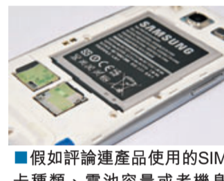
假如評論連產品使用的SIM卡種類、電池容量或者機身按鈕用途都錯誤標示，評論的可信性當然大打折扣。

1. 內容與表面事實相符。寫手在網絡上無處不在，他們可能要同時負責不同產品的評論，有時候他們可能連產品的外觀甚至規格全部都弄不清楚。要分辨網上評論真偽，最簡單的方法莫過於與現有事實比較，例如比對評論中對產品相關描述和官方網站的資料，倘若連最基本的外觀構造都弄不清楚，可以考慮忽略相關評論。