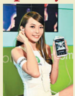
Spotify亦透過獨有的電台功能推介和助你發掘音樂，讓你以任何種類、歌曲、歌手、唱片或播放清單建立屬於你的音樂站。Spotify今日推出享譽全球、由廣告支持的免費服務，必定會令你一聽傾心，成為擁躉。若你希望於任何地方收聽心愛音樂，可以使用Spotify Premium，令你的流動裝置成為超強的音樂播放器。

全球熱播的音樂串流服務Spotify上星期於香港同步播放，由即日起，香港樂迷可以通過這個完全免費及合法的自選途徑，收聽超過2千萬首樂曲，毋須購買或下載，一按即播。你可通過電腦、手機、平板電腦或家庭影院娛樂系統欣賞悅耳音樂。你可簡單搜尋歌手、唱片或樂曲，亦可以通過瀏覽好友、歌手或名人所收聽的樂曲，發掘新音樂，也可以通過Spotify Radio享受我們為你挑選的美妙樂章。