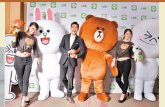
的朋友都已經將LINE的各款Sticker運用得出神入化，全港首次推出的LINE潮爆公仔掛飾將由饅頭人、熊大及兔兔領銜擔綱12款萌爆表情，令一眾LINE迷倍感興奮。12款LINE潮爆公仔掛飾為大家繪聲繪影地將心情傳送至好友、情人、家人與同事，全方位傳情達意。

而且，你有沒有試過在社交行動平台上利用LINE的貼圖傳遞你的心底話同情感？OK便利店與LINE合作，首度在港推出官方LINE潮爆公仔掛飾，讓饅頭人、熊大及兔兔等角色以多款生動搞鬼造型走進大家生活。相信有使用LINE作日常溝通平台的朋友都已經將LINE的各款Sticker運用得出神入化，全港首次推出的LINE潮爆公仔掛飾將由饅頭人、熊大及兔兔領銜擔綱12款萌爆表情，令一眾LINE迷倍感興奮。12款LINE潮爆公仔掛飾為大家繪聲繪影地將心情傳送至好友、情人、家人與同事，全方位傳情達意。