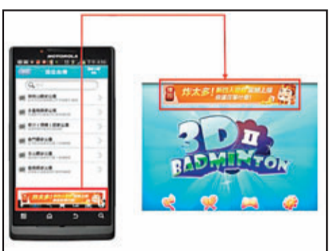
不少免費應用程式版面都嵌入廣告，開發人員透過用家點擊廣告補貼開發費用。

隨着社教網絡的興起，不少品牌都會在社交網站上建立專頁，透過專頁發佈品牌最新動態、舉辦不同類型的活動和遊戲，更可以成為用家們交流心得的互動平台。由於大部分關注專頁的用家對品牌持正面態度，專頁不單可以拉近品牌與用家的距離，更可以化身成另一種的客戶服務平台，用家不論何時何地都可以在留言提問，讓品牌給予適切的回應和跟進。