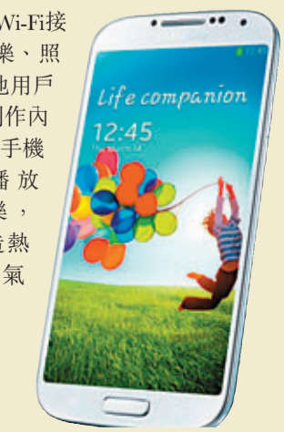
Samsung Galaxy S4，售價：HK$5,898。

藉着「Group Play (多機共樂)」功能，即使在沒有Wi-Fi接入點或手機訊號下，用戶都可以與身邊的人分享音樂、照片、文件和遊戲。這個創新的功能讓用戶可以與其他用戶直接連接，並即時分享快樂、一起遊玩，以及共同創作內容。全新功能「Share Music」讓眾多用戶同時在多部手機上播放音樂，營造熱鬧氣氛。