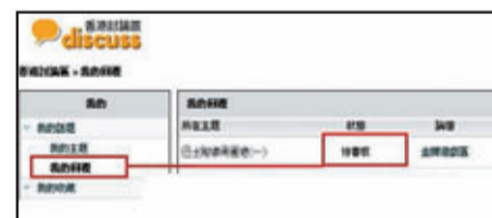
過濾寫手和過於偏激的言論，有助提高網站內資訊的可信度。

2. 多看不同評論。當寫手使用不同帳戶評論時，就要憑想像出不同情景、角度以至用不同筆鋒發表評論，此舉其實並不容易，部分經驗不足的寫手露出馬腳，寫出一些內容非常空洞的留言。當用家瀏覽評論的時候不妨多留意回覆，甚至瀏覽不同討論區多看評論，畢竟寫手要在多個討論區「造勢」需要大量資源。除此以外，社交網站上的朋友都可能是現實生活中的朋友，評論相對比討論區的更具參考價值。