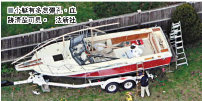
小艇有多處彈孔，血跡清楚可見。