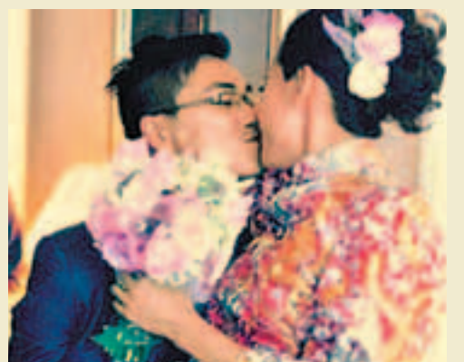
■「Mini Eden」Wedding Bouquet，好老公的選擇。

文、圖：Henry Leung 面書：Whim W-him 微博：Henry_Whim (所有花作均由Henry Leung @ Whim設計)