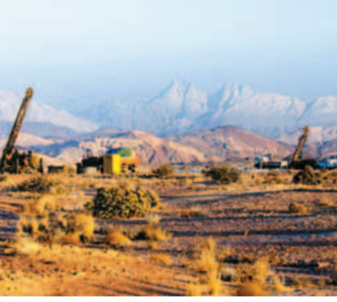
中廣核集團所屬納米比亞湖山鈾礦項目日前開工，預計於2015年年底完成。

納米比亞湖山鈾礦項目是目前中國在非洲最大的礦業投資項目，位於納米比亞西部納米布沙漠地區。該礦為近十年來非洲、乃至世界鈾資源勘查領域的重大發現之一。按最新的第三方資源量評估報告，湖山鈾礦資源儲量豐富，位列世界第三。