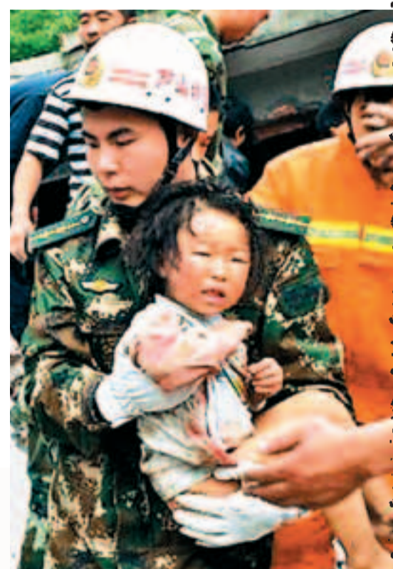
在蘆山縣地震災區，四川雅安消防救援隊員從廢墟中救出一名女孩。

但救援仍在繼續，這一刻，黃金救援24小時還沒過去。雅安還在最艱難的時刻，但也是充滿了生的希望的重要時刻。這一夜，我們都是雅安人。