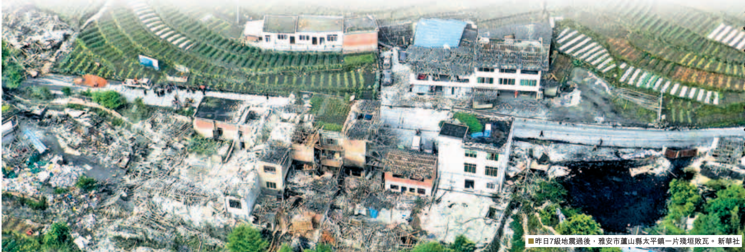
昨日7級地震過後，雅安市蘆山縣太平鎮一片殘垣敗瓦。