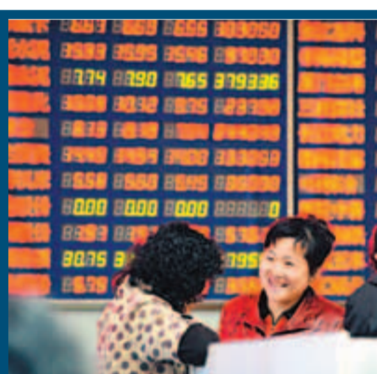
■ 滬深股市雙雙上漲，兩市成交大增。