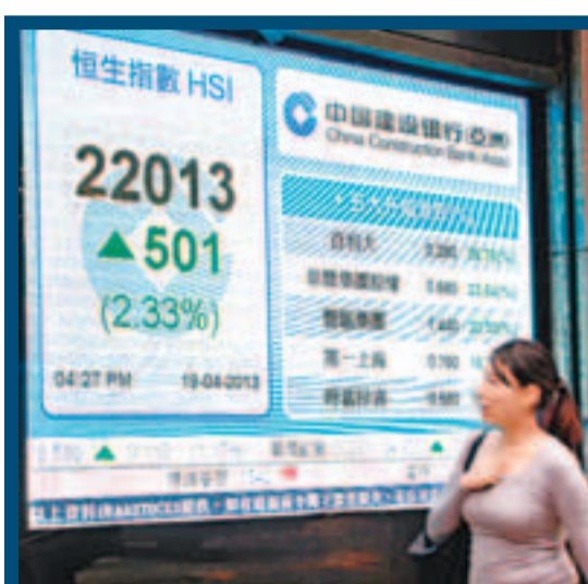
■ 港股終止5連跌，收漲501點。

而香港投資基金公會的「基金經理市場展望調查」亦顯示，逾七成受訪公司看好股票前景，當中有62%表示會增持美股，57%增持亞股。統計顯示，