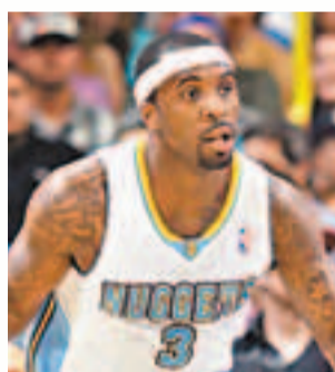
羅臣是金塊首席得分手。