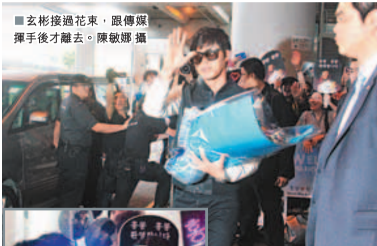
玄彬接過花束，跟傳媒揮手後才離去。