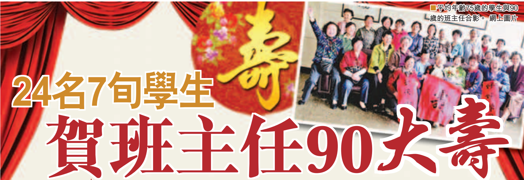
平均年齡75歲的學生與90歲的班主任合影。網上圖片