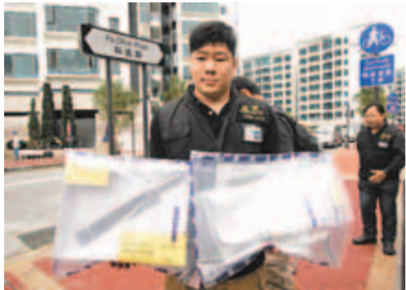
■反黑組探員展示在行動中檢獲證物包括染血西瓜刀。

據悉，2個黑幫共逾20人持械毆鬥，2名分別38歲及24歲男子受傷，現場檢獲一把染血西瓜刀。警方深入調查後，相信連串案件與爭奪上述地盤售賣飯盒生意及裝修工程生意有關，並在當日(16日)下午在大埔區拘捕4名涉案男子，至昨日先後拘捕另外11名男子。