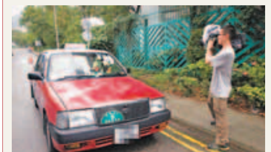
■在沙田吐露港公路支路被警方獲獲「影子的士」，證實是報失2年的失車。

據悉今次破案全賴一名有過人記憶力的警員！現場消息稱，其中一名參與昨日行動的警員，早前在休班期間曾見過一輛同一車牌號碼的士，但其車身特徵與昨日的「影子的士」有出入，「影子的士」車尾及左邊C柱上，分別有一條龍及一隻鷹的裝飾，而早前見過之的士卻沒有，不過兩者車牌號碼卻一樣，故引起該名機警警員留意，事件才得以揭發。