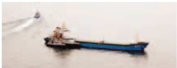
■與「海邦達199」號發生相撞貨船，船頭打橫「劃開」。