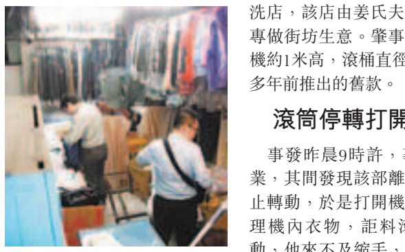
■勞工處人員到場調查。

香港文匯報訊(記者 鄧偉明、杜法祖)紅磡一間乾洗店昨發生罕見工業意外！店東操作一部舊款離心乾衣機時，疑機件出問題伸入手滾筒內圖整理衣物，其間滾筒突高速啟動，將店東左臂絞至血肉模糊僅剩皮肉相連，惟仍忍痛自行報警求救，勞工處正調查意外原因。有專科醫生指出，如手臂骨肌腱被絞碎，接駁成功機會極微，恐需截肢。