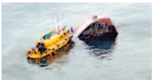
■被撞沉內地貨船「海邦達199」號僅露出船頭，消防員靠近打撈6名失蹤船員。

事發前晚7時許，「海邦達199」號載着一批建築廢料，航經赤柱黃麻角以南與螺洲之間水域時，在濃霧中與另一艘內河船「海達6」號相撞，「海邦達199」號迅速入水下沉，5人獲救，當中姓李、43歲，及姓金、46歲船員受傷送院，情況穩定。而「海達6」號上14名船員則無人受傷，但船頭被撞出一個大洞，幸無入水下沉危險。