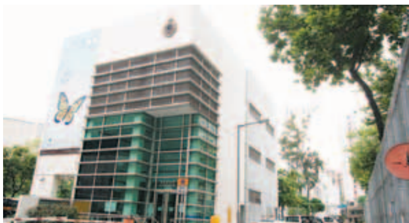
■荔枝角收押所。資料圖片

香港文匯報訊(記者 杜法祖)有人涉嫌將「探監」變成一門賺錢生意，成立公司提供代客探監的收費服務，安排職員到收押所訛稱為囚犯的朋友，在約一年之內探望近百名囚犯，甚至向囚犯送上日用品和傳遞口訊。警方接報派出臥底展開調查，終拘捕涉案3男6女，9人昨日在觀塘裁判法院被控一項串謀欺詐罪，全部否認控罪，案件押後至6月14日預審，各被告獲准保釋候審。