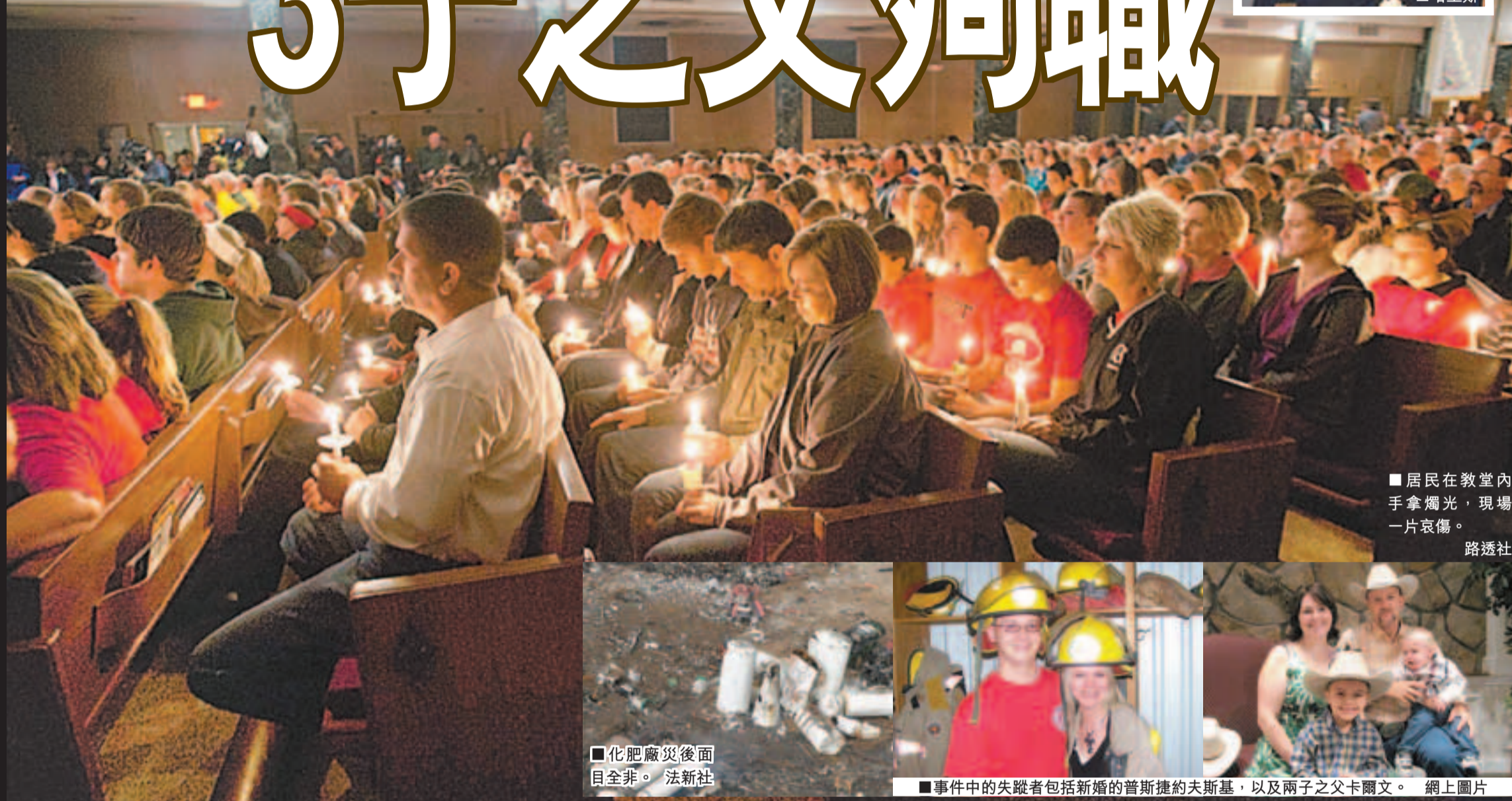
居民在教堂內手拿燭光，現場一片哀傷。