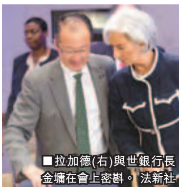
拉加德(右)與世銀行長金墾在會上密談。

歐股個別發展。英國富時100指數昨中段報6,257點，升14點；法國CAC指數報3,638點，升38點；德國DAX指數報7,467點，跌5點。