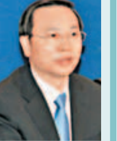
李軍，男，漢族，1962年2月出生，湖南安鄉人，研究生學歷，文學碩士，經濟學博士，研究員。曾先後任貴州省政府黨組成員、省長助理(正廳級)；任貴州省委常委、宣傳部部長、貴陽市委書記、貴陽警備區黨委第一書記之職。

香港文匯報訊(記者 虎靜、路勤寧 貴陽報導)經中共中央批准：貴州省委常委、貴陽市委書記李軍(見圖)任中共貴州省委副書記。 2007年，李軍主政貴陽，獨闢蹊徑作出要把貴陽建設成生態文明城市的決定。這背後是拒絕污染項目落地，將國字號污染大戶遷出市區，向官商勾結、毀林的知名房開商公開叫板……李軍因此被媒體譽為「生態書記」，換來沉寂許久的貴陽先後獲批國家生態文明建設試點城市、低碳試點城市。「我們不是不要GDP，而是要體現生態文明的GDP，要包含幸