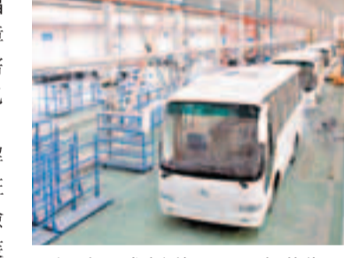
福建要求新增巴士需安裝衛星定位系統。圖為當地某汽車在下線。資料圖片 村巴站和候車亭75個，實現全省建制村開通巴士率達96%以上，並聯合相關執法部門多措並舉，確實保障福建民眾的出行安全。

香港文匯報訊(記者 傅龍金 福州報導)福建省近日相關文件保障交通安全，其中要求新增巴士需安裝衛星定位系統，以加強對巴士和司機的動態監管。 記者從當地交通運輸部門了解到，該省新增省際班車、市際班車、旅遊巴、計程車和運輸危險品貨車，要100%安裝衛星定位裝置，全省村巴安裝率要達70%以上。要求運輸企業要落實安全主體責任，通過衛星定位監控平台，加強對巴士和司機的動態監管，對不按規定使用或故意破壞衛星定位裝置的，要追究相關責任人和企業負責人的責任。今年將安排3,000萬省級補助資