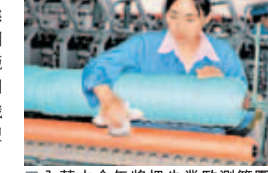
內蒙古今年將把失業監測範圍擴大到1,000家企業。圖為工人在紡織羊絨紗線。資料圖片 勞動合同、關閉破產、經濟性裁員、業務轉移和其他原因引起的崗位變化情況，同時還能有效反映出採礦、房地產、批發零售等17個行業和內資企業、港澳台商獨資企業、外商投資企業崗位變化情況以及各盟市企業崗位變化情況。

香港文匯報訊(實習記者 白佳裕 內蒙古報導)為做好失業動態監測，加強對就業形勢的科學判斷，內蒙古今年將把失業監測範圍擴大到12個盟市和2個計劃單列市的1,000家企業，監測的在崗職工48萬多人，實現了失業監測盟市全覆蓋。 經過擴展的失業監測體系將更加科學合理，從行業分佈看，各盟市企業均處於監測地區就業總量排名前10位的行業，製造業企業不超過40%。從企業規模看，中小企業不低於60%，微型企業未列入監測範圍。從企業所有制分佈看，國有企業不超過三分之一。 失業監測能有效反映出各盟市企業自然減員、正常解除或終止