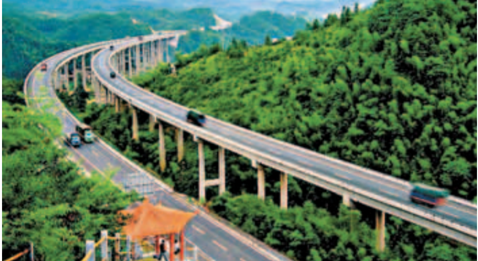
江西省將推進道路及水運建設、鐵路建設和民航建設，其中到2020年年底，全省高速公路通車里程力爭突破6,000公里。本報江西傳真

香港文匯報訊(記者 吳文倩 江西報導)江西省正加速立體交通網建設，《江西省人民政府關於進一步加快交通運輸事業發展的意見》(簡稱《意見》)已經出台，江西省將推進道路及水運建設、鐵路建設和民航建設，全力打造南昌到贛州2個小時、到上海3個小時、到北京5個小時的高鐵經濟圈。其中，按照2015年年底全省高速公路通車里程突破5,000公里的要求，將打通26條出省高速通道。