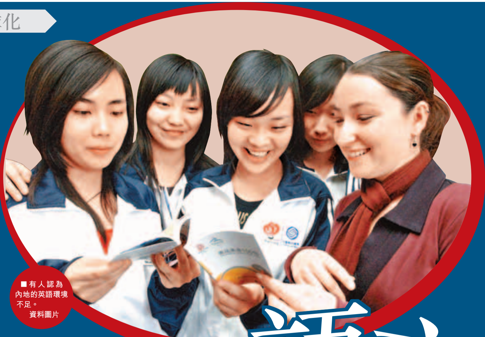
有人認為內地的英語環境不足。 資料圖片

不過，面對英語熱，內地不時有批評之聲。近日，全國政協十二屆一次會議中，全國政協委員、中國社科院信息情報研究院院長張樹華表示，重視和學習英語只是基於改革發展需要的一種手段，但有些教育部門和機構卻視此為唯一目的。英語熱耗費大量教育資源，學生在學習過程中深受其害，荒廢正常學業，令整個國家的教育質量遭受到打擊，漢語也遭到前所未有的危機。