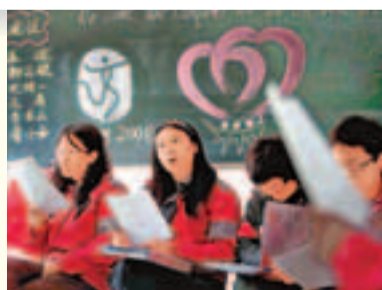
京奧將內地英語熱推向高峰。 資料圖片