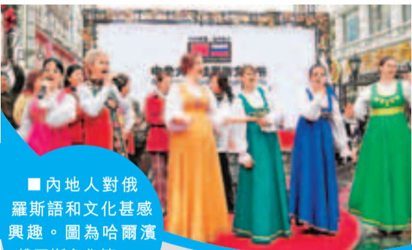
內地人對俄羅斯語和文化甚感興趣。圖為哈爾濱俄羅斯文化節。

有人建議，內地可制訂全面的語言政策。具體而言，鼓勵學生學習第二語言，但未必一定是英語。隨着國家綜合實力的提升，與各國的交流日漸廣闊和深入，內地可因應需要，培訓多種語言人才。其中一個可行考慮方向是，鼓勵民眾學習鄰近地區的外語，如東北部學生可進一步學習俄語、韓語、日語等，西南部學生可進一步學習越南語及泰文等。這將有助民眾升學、經商，也有利國家培育更多熟悉其他國家語言文化的人才。