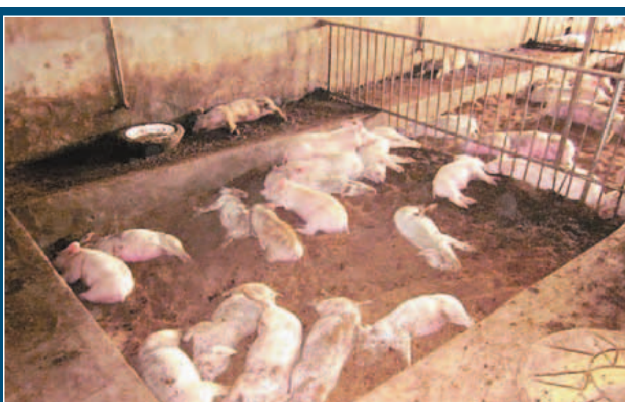
當地一養豬戶的200頭豬全部在豬欄死亡。

同時,洛陽市環保局專家對東屯村的空氣和飲用水及家畜用水進行了檢測,稱未檢出氨氣、氯氣、氯化氫、氟化氫等有害氣體,水質亦達標。公安部門也組織警力提前介入查找線索,進行相關刑事偵查。