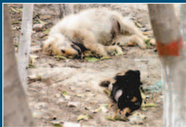
東屯村裡不少狗隻死在路邊。