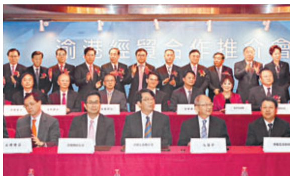
經貿合作推介會暨簽約儀式現場。

據重慶市政府介紹，2012年該市金融業增加值佔比提高到8%，金融機構本外幣存款餘額19,423.9億元，同比增長20.4%，存款增幅排全國第四，貸款餘額10,919.8億元，同比增長9.5%。銀行、證券、保險及非銀行金融機構已近500家。目前該市七大金融要素市場健康發展，交易額超3,000億元。