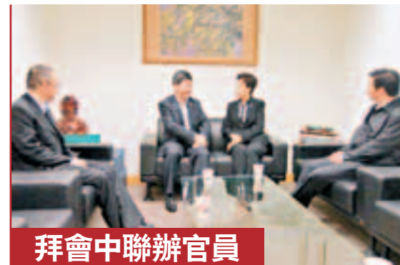
中聯辦副主任郭莉昨日會見港舉行安順市招商推介活動的安順市代市長王術君、市委副書記陽向東、副市長郭偉誼一行。

招商局集團常務董事袁武、中國城市競爭力研究會會長桂強方、香港貴州聯誼會會長鄧小宙、香港文匯報董事總經理歐陽曉晴等出席了推介會。