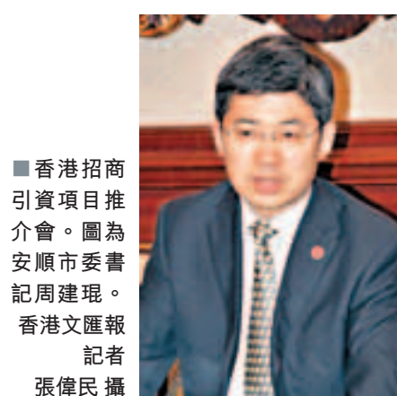
香港招商引資項目推介會。圖為安順市委書記周建琨。

香港文匯報訊(記者 劉璇)貴州省安順市委副書記、代市長王術君昨在參加貴州安順香港招商引資推介會時，接受