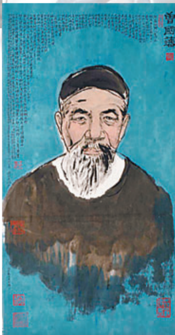
■王德水書畫作品——曾國藩肖像