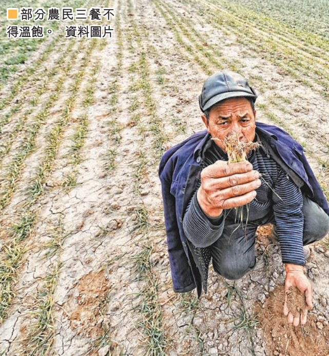
部分農民三餐不得溫飽。資料圖片