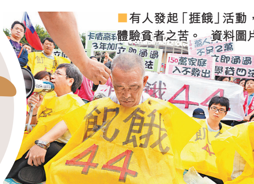
有人發起「捱餓」活動，體驗貧者之苦。資料圖片