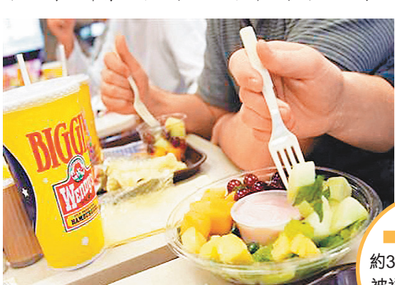
美國每年有約3,600萬噸食物被送往堆填區。網上圖片

美國自然資源保護委員會近期發表報告指出，美國人每年浪費的糧食，高達全國總產量四成。據估計，美國人每年扔掉的農產品總值1,600億美元，每年約3,600萬噸食物被送往堆填區。以一個美國4人家庭為例，每年丟棄相當於2,200美元的食物。美國這種糧食浪費程度持續惡化，現時較上世紀70年代增加50%，浪費層面遍及整個糧食供應鏈的各個環節。