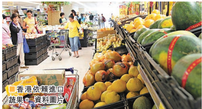
香港依賴進口蔬果。資料圖片