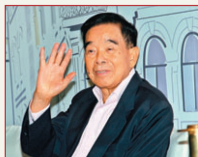
華人第四富：鄭裕彤