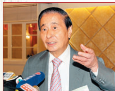
華人第二富：李兆基