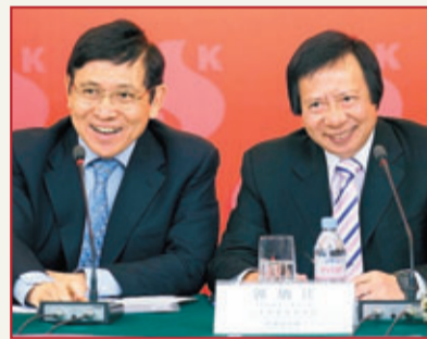
華人第三富：郭炳江(右) 郭炳聯(左)