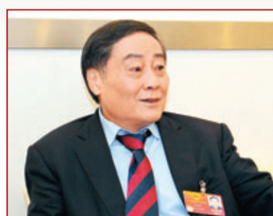
華人第九富：宗慶后