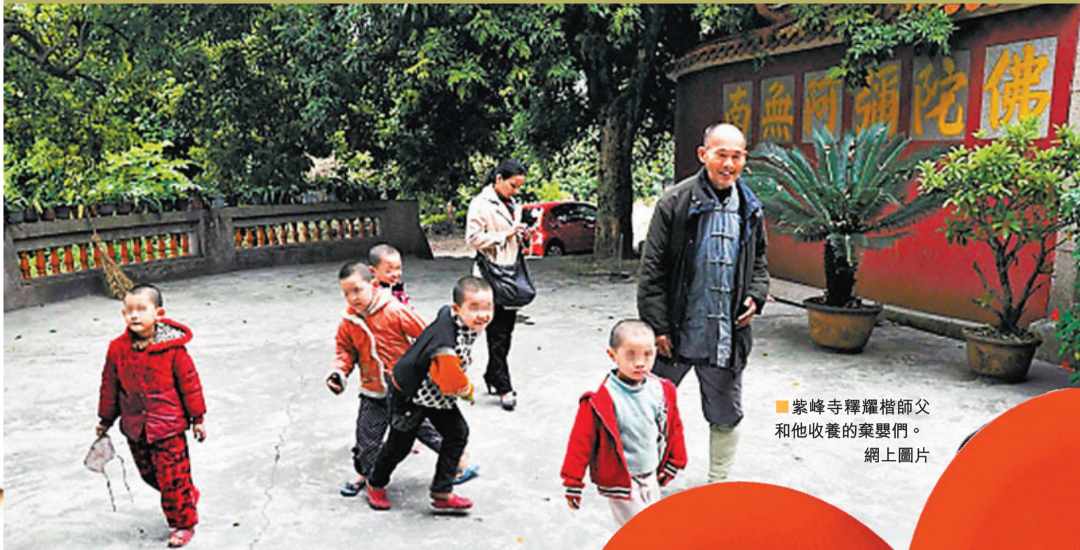
紫峰寺釋耀指師父和他收養的棄嬰們。

2013年1月4日，河南省蘭考縣城關鎮一居民樓發生火災。這場火災奪走7個孤殘兒童的生命，誰也沒想到，一場大火「燒出」了孤殘兒童悲慘的境遇；「燒出」了內地民間收養的困境；「燒出」了孤兒救助和收養工作制度漏洞。同時，「愛心媽媽」袁厲害從此成為飽受爭議的公眾人物。她雖只是一名普通農村婦女，但其收養逾百棄兒的做法實為「厲害」之舉。