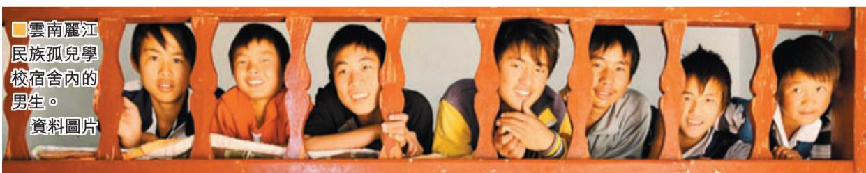
雲南麗江民族孤兒學校宿舍內的男生。 資料圖片