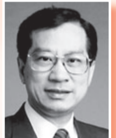
永遠名譽顧問 潘宗光教授