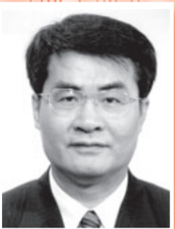
中央人民政府駐香港聯絡辦公室副主任 黃剛先生