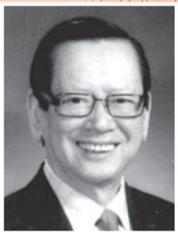
永遠名譽顧問、中國僑聯副主席 陳有德博士