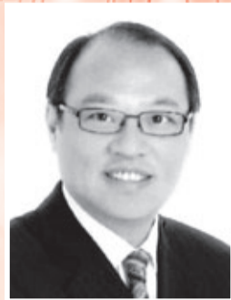
永遠名譽顧問、香港立法會(工業界)議員 林大輝博士