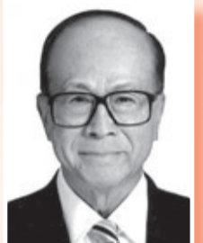
永遠榮譽會長 李嘉誠博士