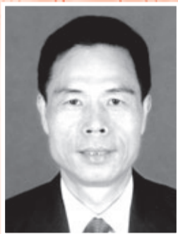
中共廣東省委統戰部副部長 楊浩明先生