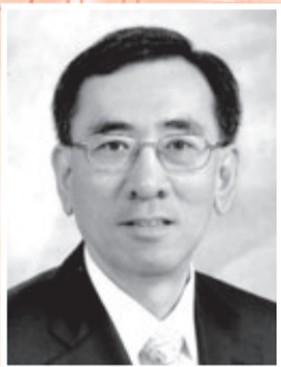
香港特區工業貿易署署長 麥靖宇先生