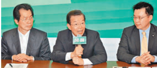
謝長廷(中)傳下月在港辦兩岸論壇。圖為其去年舉行記者會，說明登陸行程。