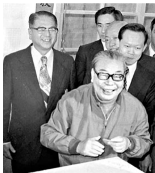
林洋港(左後)1977年時任台北市長，陪同當時「行政院長」蔣經國(前)投票選舉台北市議員。