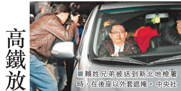
賴姓兄弟被送到新北地檢署時，在後座以外套遮擋。

馬英九表示，林洋港在台北市長任內，排除萬難，決定興建翡翠水庫，讓大台北地區在往後的20幾年間享有全台最乾淨、最便宜、且供應無虞的飲水，是一個高瞻遠矚的睿智決定。馬英九說，他過去在台北市長任內，曾送過「阿港伯」一個水晶做的翡翠水庫模型作紀念，希望大家跟他一樣要記得「飲水思源」。