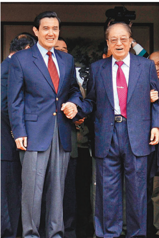
林洋港(右)前晚病逝，享壽86歲。圖為2010年春節期間，馬英九向其拜年。