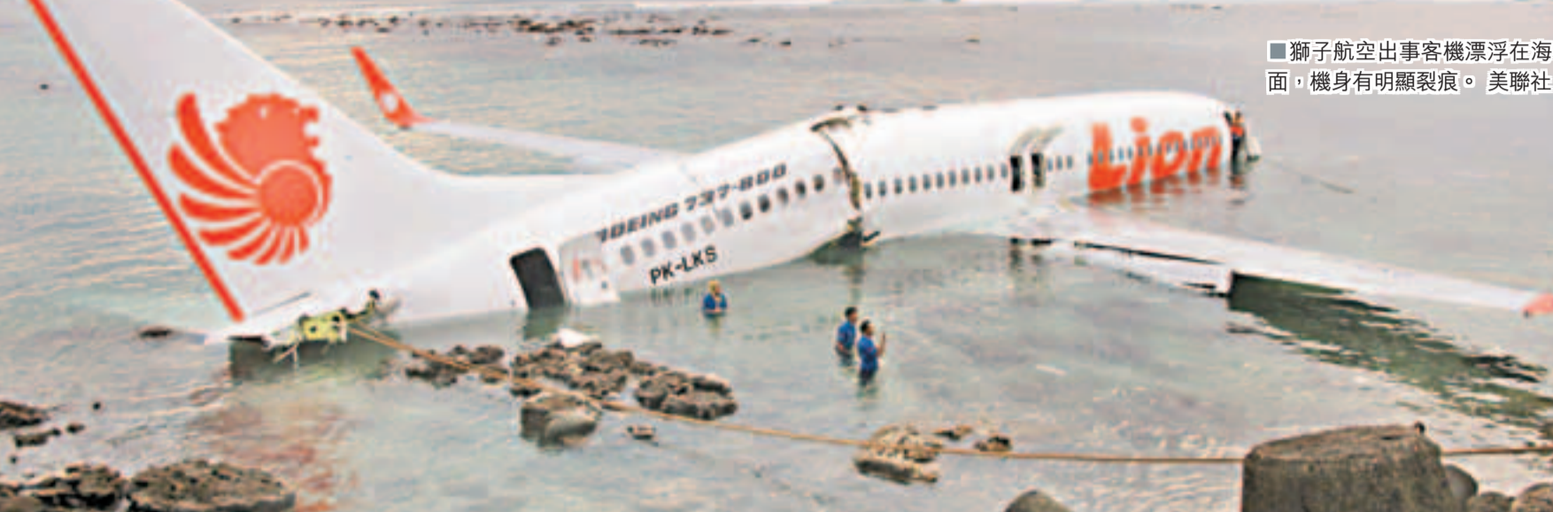
■獅子航空出事客機漂浮在海面，機身有明顯裂痕。

印尼廉價航空公司獅子航空(Lion Air)一架載有108人的波音737客機，昨日下午在峇里島降落時墮海，機身斷成兩截，所有乘客奇跡生還，據悉最少53名乘客受傷，當中22人送院。有乘客稱飛機在毫無先兆下墮海，事發時機上情況混亂，許多乘客驚恐尖叫。中國駐泗水總領館官員表示，暫未知機上是否有中國乘客，將與機場方面核實。本港旅遊業議會表示，本港旅行團很少乘搭獅航到峇里。