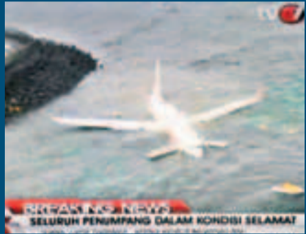
■有乘客稱飛機在毫無先兆下墮海。法新社