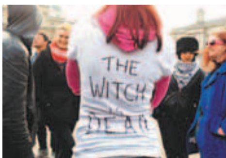
■有反鐵娘子的人士在衣服背後寫上「巫婆死了」的字眼。

的25歲學生弗朗西斯則號召，在周三戴卓爾夫人禮葬進行當天，在靈車經過時轉身背對，以示不滿禮葬耗費大量公帑，至今有數千人響應。