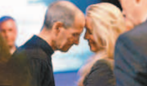
■喬布斯生前與勞倫十分恩愛。

蘋果產品風行全球，時刻提醒勞倫亡夫的貢獻，她希望子女也有同感。勞倫最近與奧斯卡金像大導演維斯古根漢合作拍攝電影《The Dream is Now》，道出無證移民學生在美國成長的苦況。■《每日郵報》