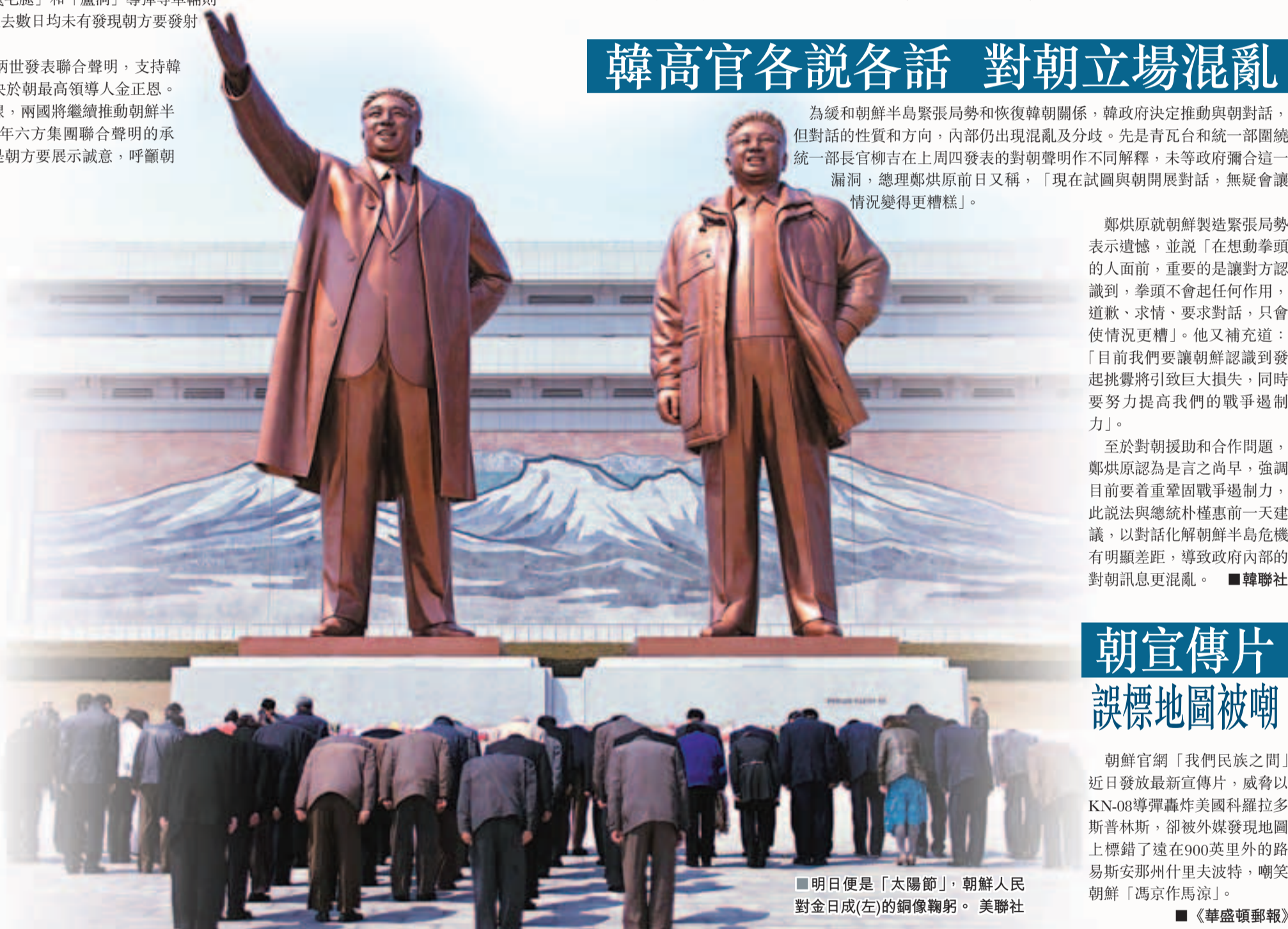
■明日便是「太陽節」，朝鮮人民對金日成(左)的銅像鞠躬。

朝鮮官網「我們民族之間」近日發放最新宣傳片，威脅以KN-08導彈轟炸美國科羅拉多斯普林斯，卻被外媒發現地圖上標錯了遠在900英里外的路易斯安那州什里夫波特，嘲笑朝鮮「馮京作馬涼」。■《華盛頓郵報》