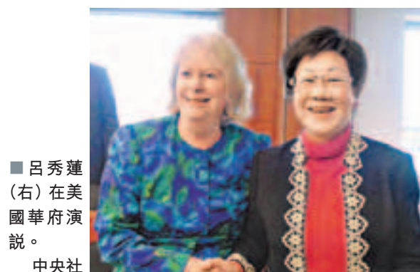
呂秀蓮(右)在美國華府演說。

香港文匯報訊 綜合報導，台灣前副「總統」呂秀蓮昨天在華府表示，兩岸最好的解釋是遠親近鄰關係，她認為台灣未來走向絕對受國際與中國大陸影響，民進黨應該花更多時間了解大陸，不要只放精力在個人選舉。