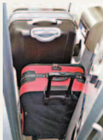
高鐵路車12日發現不明行李，後證實內有爆裂品。

香港文匯報訊 綜合報導，台灣高鐵路車與「立委」盧嘉辰服務處12日先後遭人放置爆裂物，警方初步鎖定為同一批人所為。由於兩起爆裂物案，都發現有可以助燃的硝酸銨粉末，警方懷疑歹徒有化工背景，正循線追查。同時警方也透過監視器以雲端科技分析資料，鎖定車號追人。前天上午高鐵路車發現爆裂物後，不到3小時又在「立委」盧嘉辰新北市服務處發現同類型爆裂物。時間接近且爆裂物構造相近，由鐵路警察局高鐵路警務段、刑事局偵五隊、偵七隊與新北市警局組成的專案小組初步鎖定是同一批人所為。警方已調閱高鐵路車站與「立委」服務處附近監視器進行比對。包括「立委」服務處監視器畫面中，發現一名男子穿反光雨衣、戴鴨舌帽，雙手各提裝有爆裂物的箱子至盧嘉辰的服務處門口，又折返車上將寫有「關聖帝君千秋 馬英九」的字條貼在行李箱上。警方已鎖定該輛休旅車的型號、車牌號碼，將以雲端技術交叉比對，追查該名男子的身份，並重建其犯案路線。另外，警方認為2件爆裂物，都是出自同一集團，先清查擁有專業爆破知識的人口，再逐一排除，加上高鐵站的進出監視器，目前已經掌握70人的關鍵身影。