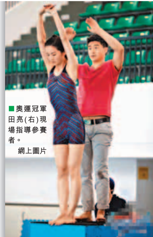
奧運冠軍田亮(右)現場指導參賽者。網上圖片