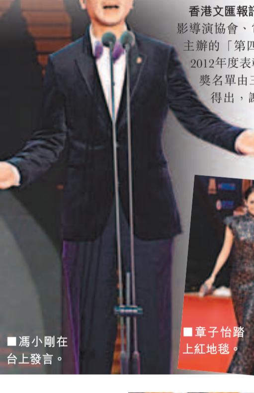
馮小剛在台上發言。

香港文匯報訊(記者 寧寧)中國電影導演協會、電影頻道(CCTV6)聯合主辦的「第四屆中國電影導演協會2012年度表彰大會」昨晚舉行，獲獎名單由三百餘位會員導演投票得出，謝飛導演獲頒傑出貢獻導演獎。紅毯上陶虹夫婦閃亮亮相。馮小剛、張國立、李少紅、劉儀偉、管虎、陸川、張一白、高群書、李雪健、徐帆、黃渤、王寶強、顏丙燕、黃海波、張歆藝等著名電影導演和演