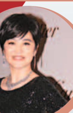
謝飛導演獲電影導演協會2012年度表彰大會傑出貢獻導演。

另外，該品牌昨日亦在台北101大樓舉辦頂級珠寶展晚會，藝人陳妍希(見下圖)也佩戴珠寶盛裝出席活動。