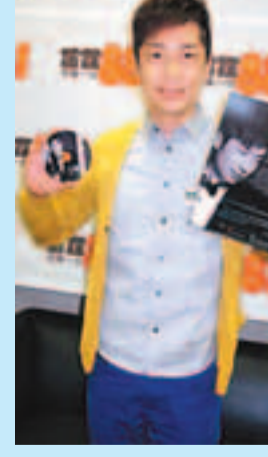
馬浚偉在台上發言。

香港文匯報訊(記者 李思穎)馬浚偉(見圖)的全新專輯將於六月推出，昨日他到電台宣傳，並透露稍後會舉行試聽會，七月會有音樂會。說到馬仔重返TVB拍劇，他承認正在跟珍姐(曾勵珍)傾談階段，今次條件不錯，對酬勞感滿意，唯一是要適應TVB的工作模式，因無錢是一日兩組，內地拍劇是一日一組，但他不會向TVB作特別要求，不想令人覺得他有特別待遇。他覺得現時TVB也多關心了藝人的休息時間。有提議他帶頭同TVB傾一日一組的工作時間，這一來可幫其他演員謀福利，說不定當上英雄，馬仔哈哈笑說：「這位置很難做，講就英雄，唔覺意可能做了狗熊。」