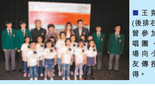
王菀之(後排右四)曾參加合唱團，現場向小朋友傳授心得。

今年合唱節請來世界各地不同團體到來，王菀之最期待與芬蘭合唱團合作，她說：「知道他們純人聲不用樂器，而且甚麼歌都唱到，我打算給一首廣東話歌試聽他們，看看他們是否那麼厲害。」Ivana本身也對芬蘭情有獨鍾，一直恨去當地找聖誕老人和去與她英文名同名的時裝店見識。問她與其他唱家班合作會否怕被比下去，Ivana笑道：「不驚，大家都一樣靚聲，我都想唱芬蘭語歌。」會否叫家人一起出來表演？她說：「要看父母肯不肯出山，我哥哥的仔女就五音不全，他們都轉向畫界發展。」