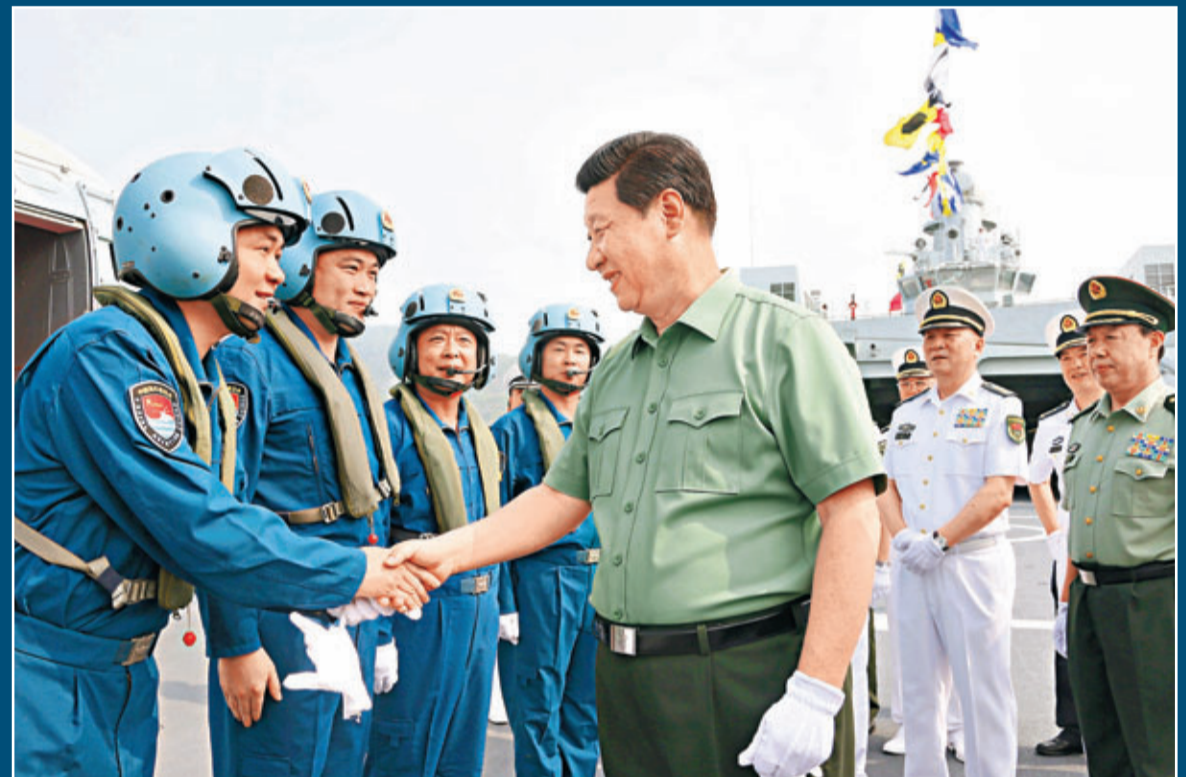
■習近平在井岡山艦上與艦載直升機飛行員親切握手。

據此間官媒報道，9日上午，習近平身穿短袖軍便服，來到海軍某驅逐艦支隊軍港碼頭。受閱的南海艦隊5型11艘新型主戰艦艇懸掛滿旗，依次排成艦陣。習近平檢閱水兵儀仗隊後，登上敵蹤艦，依次檢閱了岳陽艦、衡水艦、玉林艦等艦艇。