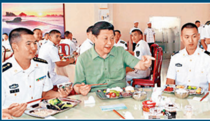
■習近平與水兵們共進午餐。

香港文匯報訊 據中新社報道，中共中央總書記、國家主席、中央軍委主席習近平在出席博覽亞洲論壇2013年年會相關活動後，專程來到海軍駐三亞部隊，勉勵官兵們堅定強軍信心，獻身強軍實踐。習近平強調，部隊思想政治建設的一項重大任務，就是要教育引導廣大官兵牢記強軍目標，努力把個人理想融入強軍夢。