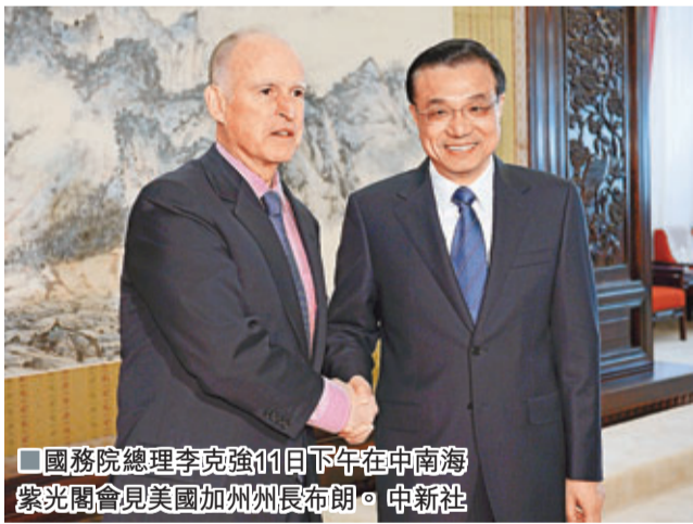
■國務院總理李克強11日下午在中南海紫光閣會見美國加州州長布朗。

布朗表示，加州是美國面向中國和太平洋的門戶，歡迎更多中國人到加州投資、留學，加州願成為美中兩國友好交流、合作互信的助力器。