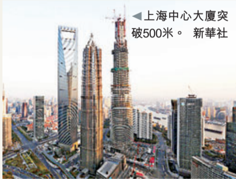
上海中心大廈突破500米。

香港文匯報訊 目前正在建的內地第一高樓、總高度632米的「上海中心」主樓核心筒結構11日澆築完畢第108層，高度突破500米，達到501.3米。這一高度超過了陸家嘴地區另外兩座摩天大樓——高度為421米的金茂大廈和492米的上海環球金融中心，刷新了「上海高度」。