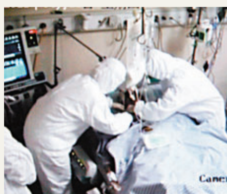
在浙江省浙一醫院H7N9重症監護室監視器上看到,患者正在接受治療。