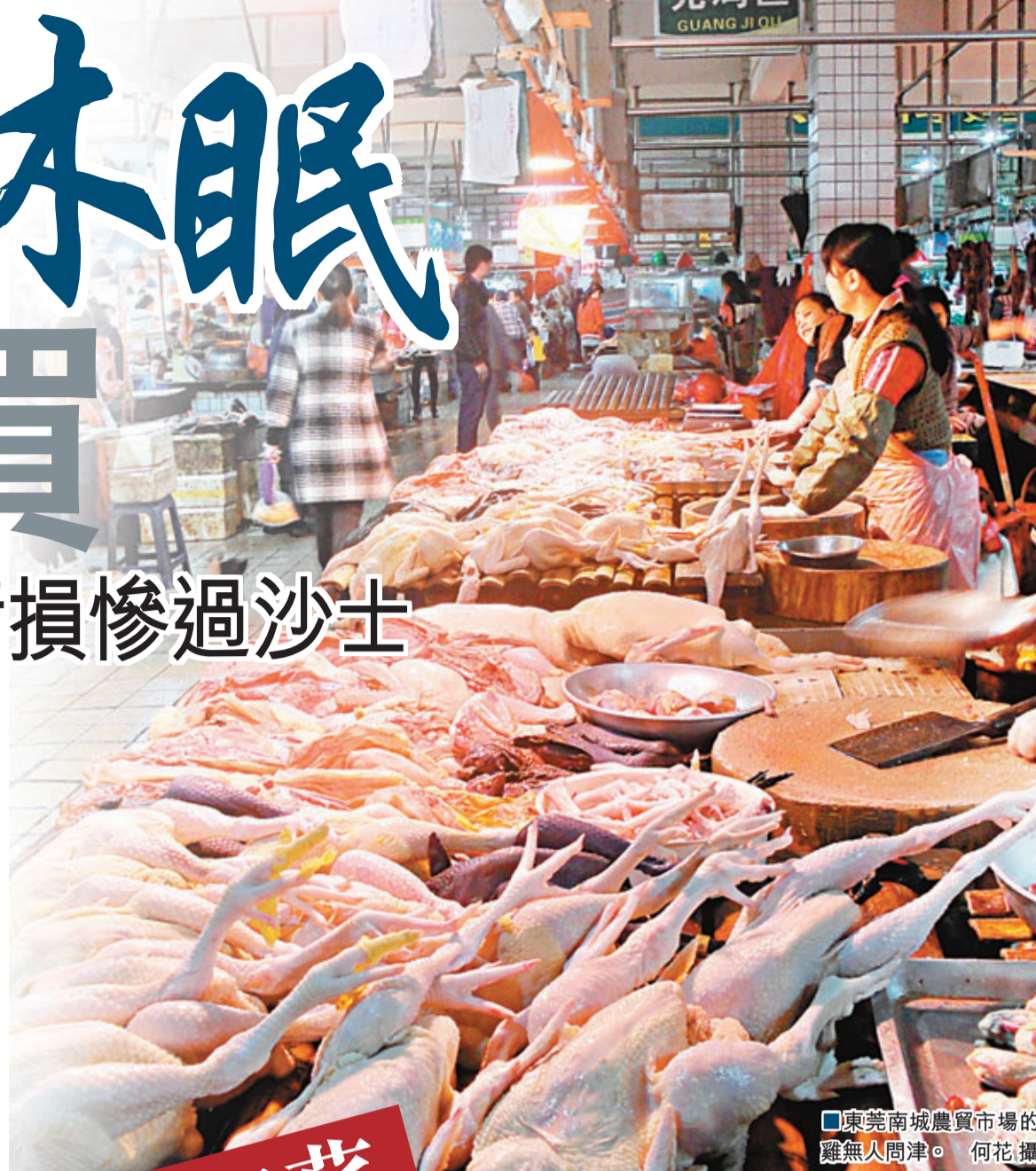
東莞南城農貿市場的雞無人問津。

專家們表示,候鳥等野生動物直接將H7N9禽流感病毒傳播給人的可能性較低,而病毒通過中間宿主對人感染並引發疫情的可能性較大。