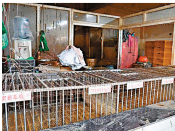
目前華東地區部分省市已暫停活雞交易。

面對H7N9禽流感給相關行業帶來的影響。農業部部長韓長賦10日主持召開專題會議,進一步研究部署H7N9禽流感防控工作。韓長賦稱,要認真貫徹落實國務院常務會議精神,繼續狠抓各項防控措施落實不放鬆,盡最大可能降低病毒由動物傳播給人的風險。此外,將密切關注疫情對家禽產業發展的衝擊和影響,採取積極應對措施,切實穩定養禽業發展。