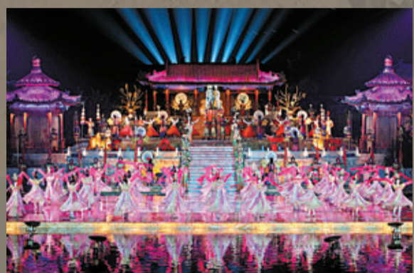
■2013版大型實景歷史舞劇《長恨歌》在華清池畔再度華彩登場

陝西南北長約880公里，縱跨三個氣候帶，自北向南形成了三大自然景觀區。走進陝西，除了感受眾多的歷史遺存，人們還能領略以險峻著稱的西嶽華山、氣勢恢宏的黃河壺口瀑布、一瀉三千里的漢江源頭、六月積雪的秦嶺主峰太白山、古樸渾厚的黃土高原等令人稱奇的自然景觀。「山水人文·大美陝西」已成為陝西旅遊的新品牌。