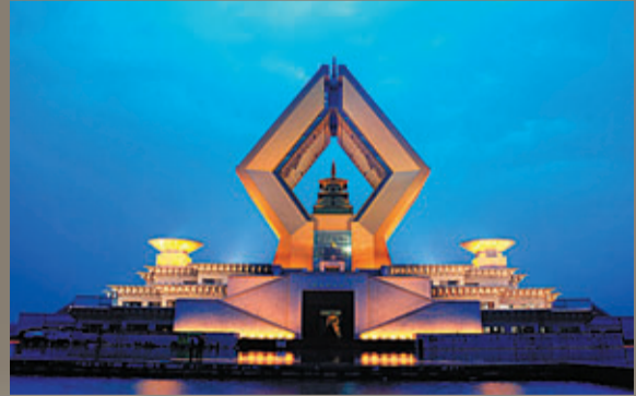
■法門寺合十舍利塔