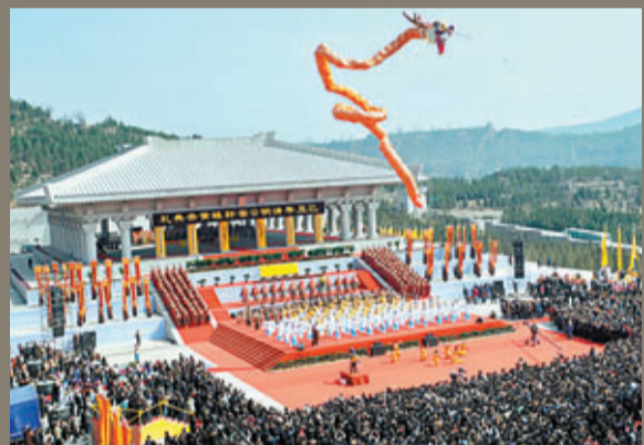
■每年清明的黃帝陵祭祖典禮