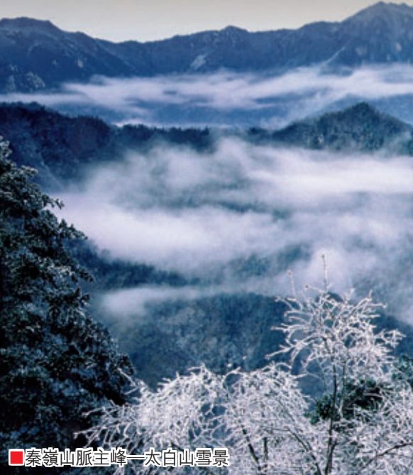
■秦嶺主峰太白山雪景