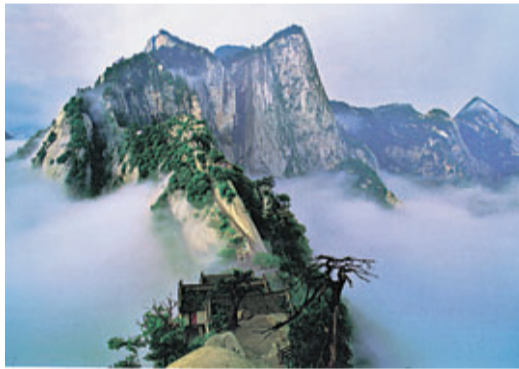
■有着「天下奇險第一山」之稱的西嶽華山

華山素有「奇險天下第一山」之稱，是中國著名的五嶽之一，海拔2154.9米，位於陝西省西安以東120公里華陰市境內，北臨坦蕩的渭河平原和咆哮的黃河，南依秦嶺，是秦嶺支脈分水脊北側的一座花崗岩山。憑藉大自然風雲變幻的裝扮和磨礪，華山的千姿百態被有聲有色地勾畫出來，早在1982年就被國務院確定為首批國家重點風景名勝區，2010年又被國家旅遊局評為5A級旅遊景區。華山險峻挺拔，清風傲骨，是歷來豪傑論劍、墨客談文、道家修煉的世外佳境。今年4月1日，華山西峰索道正式開通，結束了西嶽華山17年來只有一條索道的歷史，遊客從此可追隨金庸的腳步，輕鬆直達華山主峰，飽覽東、西、南、北、中五峰美景和雄險，共同去感受「華山論劍」的魅力。