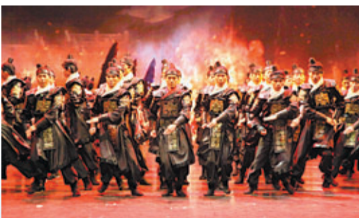
現代時尚的新陝西，將為您鋪就一條訪古尋根、休閒溫馨和快樂生活的旅途。

「不入園林，怎知春色如許。」走進陝西，就是閱讀歷史；走進陝西，就是融入文化；走進陝西，就是享受生活。在旅遊的大坐標上輕鬆地鎖定陝西，您將會穿梭在上下五千年的時空隧道。從遠古的榮耀與輝煌，到今天的發展成就，一個開放包容、大氣恢弘、氣象萬千、