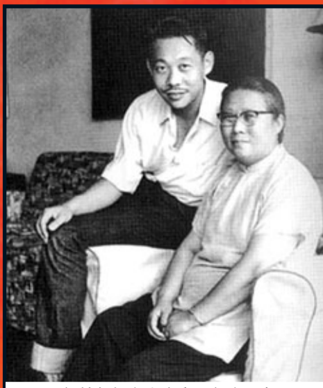
1975年趙無極在上海與母親在一起。