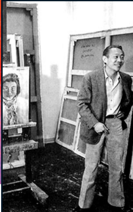
1970年趙無極在巴黎畫室中。