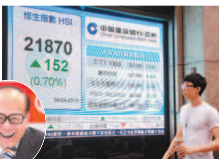
內地通脹數據回落,刺激3連跌後的港股回升152點。

國指收報10,610.7點,升181點或1.74%,跑贏大市。港股全日共746隻主板股份上升,下跌股份278隻。匯控(0005)尾市創今年新低,收報80.9元,跌幅0.43%,內地保險股回升,國壽