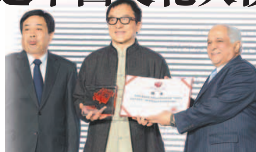
■成龍擔任2013年沙特傑納利亞遺產文化節「中國文化大使兼主賓國館榮譽館長」。

香港文匯報訊(記者 張瀛戈)以傳承本國傳統文化為宗旨的沙特傑納利亞遺產文化節每年都邀請一個友好國家作為主賓國參展，以加強不同文化之間的對話和交流。在阿拉伯世界擁有無數「粉絲」的成龍受聘為此次文化節的「中國文化大使兼主賓國館榮譽館長」。據悉，開放第一天主賓國中國館就是一大熱門，很多成龍的粉絲等待其出現。由於檔期問題成龍未能在開館當日出現，但是並不影響沙特人對中國文化的熱情和興趣。很多沙特人在參觀中國館後激動地說，這個展覽讓他們第一次近距離接觸遙遠而神秘的東方古國，中國燦爛文化和悠久歷史讓他們無比敬佩，也讓他們要到中國去旅行的想法更加強烈。