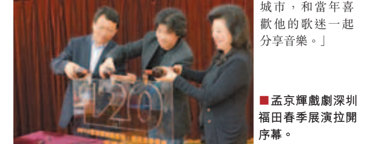
■孟京輝戲劇深圳福田春季展演拉開序幕。

全球巡演中國佔4站 另外，全球首席拉丁情歌歌王胡里奧·伊格萊西亞斯將到深圳舉辦「情歌之巔——胡里奧世界巡迴演唱會」。胡里奧是迄今來深開騷的海外藝人中，最具國際影響力的天王級歌手。在此次全球巡迴中除了京滬兩地以外，他還特別增加了中國內地的成都和深圳兩地。經理公司透露這是其本人的意願，因為他對中國有着特殊的情感，他說過：「在我的生命中，兩次中國之行是我藝術生涯最輝煌的時刻，來到這個美麗的國度一直是我的榮幸。我至今記得我第一次唱《鴿子》，現場觀眾是多麼喜歡它，那個場景一直在我的記憶中。希望在自己的藝術生涯結束後，能走訪更多中國城市，和當年喜歡他的歌迷一起分享音樂。」