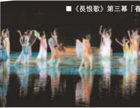
■《長恨歌》第三幕「春寒賜浴華清池」。