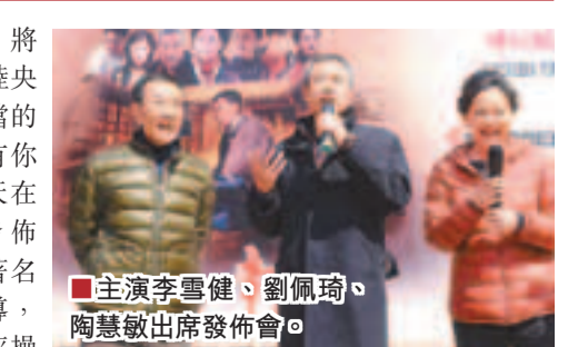
■主演李雪健、劉佩琦、陶慧敏出席發佈會。

中新社電 將於4月11日登陸央視一套黃金檔的情感大戲《有你有才幸福》今天在北京舉行發佈會。該劇由著名導演王瑞執導，著名編劇陳枰操刀，並集結了李雪健、劉佩琦、陶慧敏等實力派戲骨，講述了57歲的「老北京」祺瑞年所遭遇的老房拆遷、老伴去世、子女財產分割等一系列生活和情感危機，劇中大膽涉及諸多民生敏感問題，諸如拆遷、黃昏戀、房產爭奪、啃老、空巢等，堪稱中國版的《老無所依》。