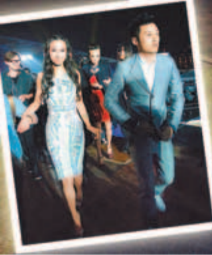
■Angelababy與余文樂、陳國輝在熱氣球下合照留念。