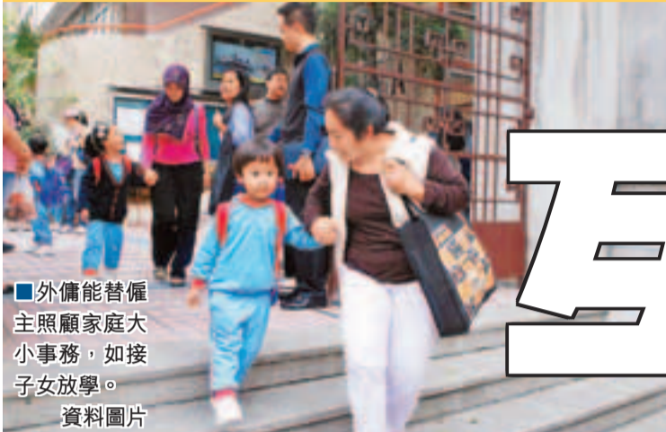
■外傭能替僱主照顧家庭大小事務，如接子女放學。資料圖片