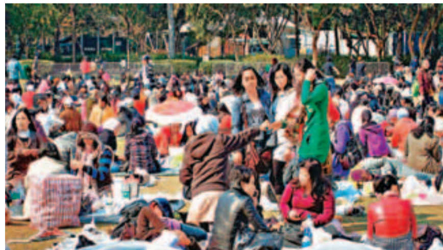
■每逢公眾假期，外傭都會三五成群地聚在一起，陣勢壯觀。資料圖片