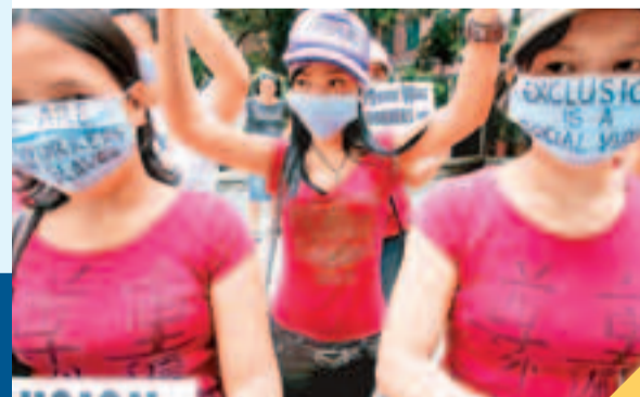
■有香港外傭組織遊行爭取僱主尊重。

儘管香港有一定法律保障外傭的合法權益，菲律賓、印尼等女傭在港工作期間受到侵犯及人身安全受威脅的個案屢見不鮮，如被要求延長工時、拖欠工資、受到僱主責罵、言語暴力甚至非禮等。更有不少人在惡劣生活環境下工作，如在僱主未起床前不可上廁所、喝水喉水，甚至有傭主因心情不佳而放狗咬家傭。截至2007年10月底，共有169名香港僱主被列入菲律賓駐港總領事館的僱主「觀察名單」，他們暫時被禁止再聘請菲傭。不過，另一方面，香港僱主受害的個案也不相伯仲，如